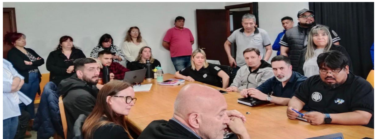
No hubo acuerdo en la mesa salarial para los escalafones seco y húmedo, porque los gremios rechazaron la propuesta del gobierno por “insuficiente”.

“Desde un comienzo siempre elegimos lo mismo, los porcentuales que se den, tienen que ser parejos para todos.