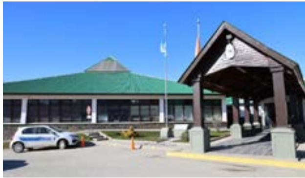
Ushuaia: Aplican pena de 4 años de prisión a un hombre que abusó de sus hermanas cuando era menor de edad