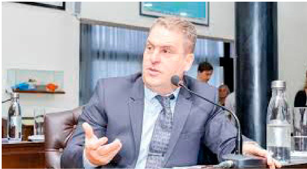
El legislador provincial Raúl von der Thusen consideró “muy grave” la situación que atraviesan más de 540 policías territoriales retirados, que llevan casi cinco meses sin percibir sus haberes completos

Por último, mantuvo que “voy a seguir peleando por eso, a partir del 10 de diciembre quiero llevar este reclamo a los diputados y senadores nacionales, dado que Tierra del Fuego necesita una política aérea justa y federal”, concluyó.