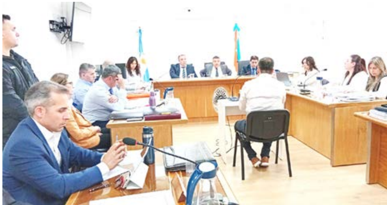
Declararon los padres del bebé fallecido en una extensa y dolorosa jornada