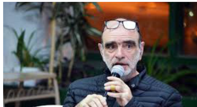
El gremio de las y los docentes de la Universidad Tecnológica Nacional lleva adelante medidas esta semana, para reclamar que el Gobierno nacional cumpla con la Ley de Financiamiento Universitario que fue aprobada por el Congreso.

Luego expresó: “para nosotros ya no es una situación nueva la arbitrariedad y el capricho del gobierno, la situación de ilegalidad que tiene no nos representa