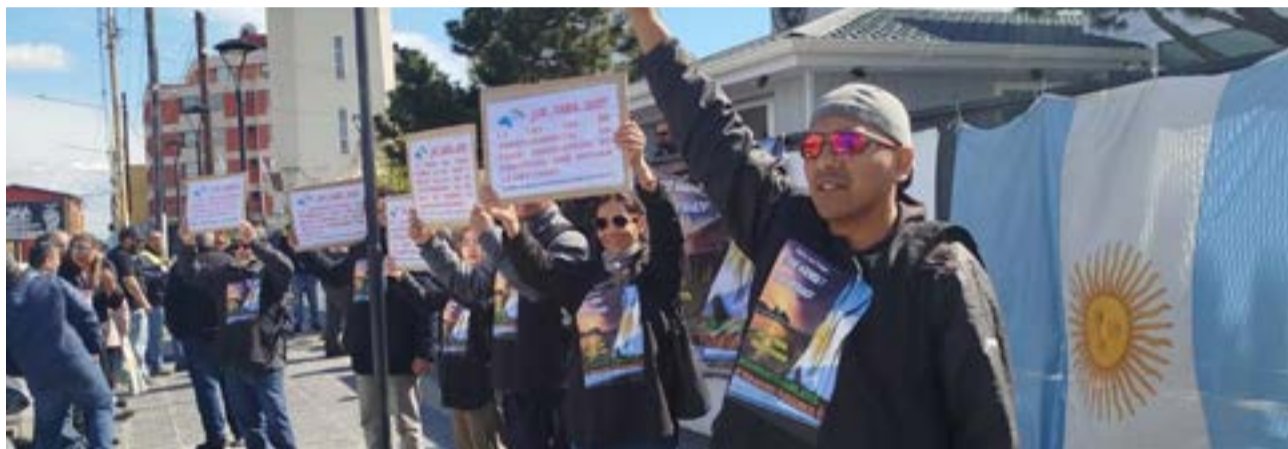
Desde el Movimiento de Trabajadores, Estudiantes Universitarios y Jubilados de Tierra del Fuego, dirigieron una carta abierta a las legisladoras y los legisladores de la provincia.

Finalmente, se expresa que “dada la situación