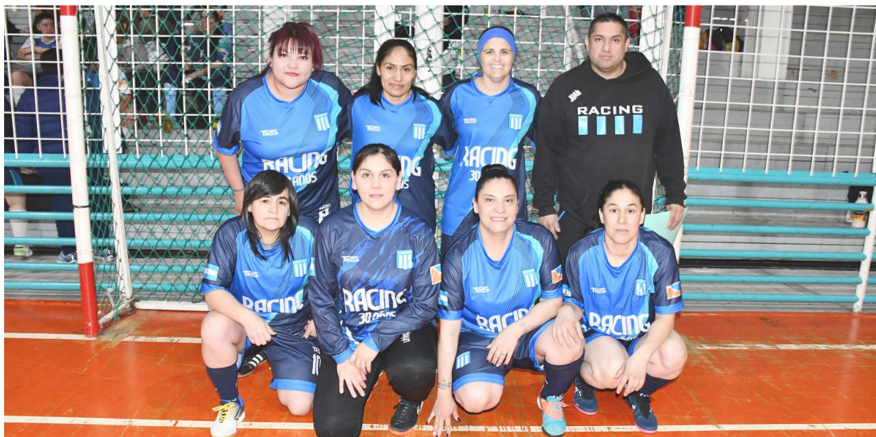
El equipo del Club Racing Río Grande, primera división "A".

Volver a ver a jugadoras que fueron protagonistas de los primeros torneos es, para muchos, como revivir una historia que nunca terminó. Las veteranas, las que alguna vez formaron parte de los equipos fundadores, regresan a su casa deportiva, y lo hacen con la misma alegría de siempre. Es que el fútbol femenino de Río Grande no solo ha sido un espacio de competencia, sino también de afecto y comunidad.