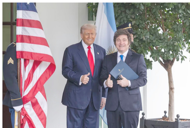
El gobierno de Estados Unidos formalizó este jueves la firma de un convenio marco para un Acuerdo sobre Comercio e Inversión Recíprocos con Argentina.

En materia de propiedad intelectual, el documento señala que Argentina avanzó en la lucha contra la falsificación y piratería de bienes, tanto en mercados físicos como digitales. El país asumió la responsabilidad de abordar cues-