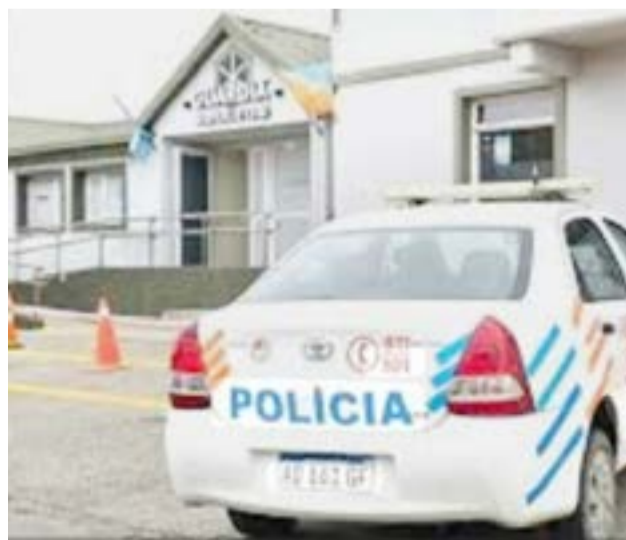
Una profesional de la salud fue trasladada desde nosocomio a sede judicial y denuncian trato “como delincuentes”, tras el fallecimiento de un hombre.

“La doctora fue sacada esposada con un celular en la puerta, con un personal que estaba filmando todo, con lo que se pone en crónica, no sé cuál, un