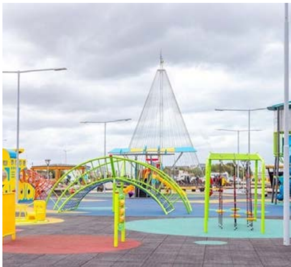
La Secretaría de Obras y Servicios Públicos informa que se están realizando trabajos de mejoras en diferentes sectores del Parque, entre ellos el área donde recientemente se instaló el "Barquito Azul".

cho. Estos espacios también van a estar identificados con vallas o cintas de seguridad. Desde el Municipio de Río Grande se solicita a la comunidad acompañar los trabajos que se están desarrollando y cuidar los espacios, per-