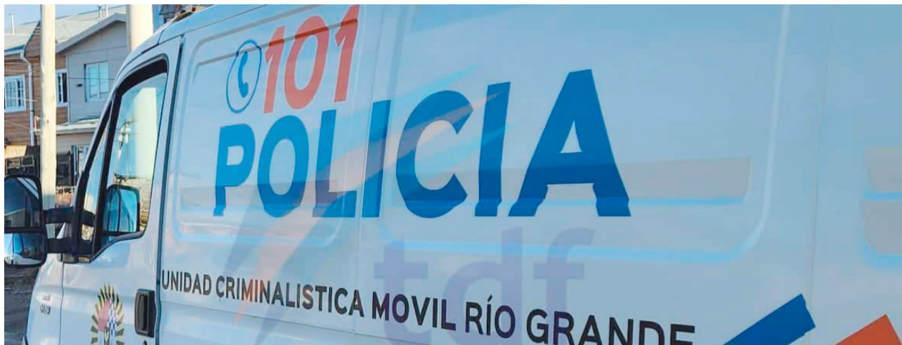
Un cabo de la Policía Provincial fue hallado sin vida esta mañana de domingo en el domicilio que ocupaba en el predio de su familia sobre calle Shelknam de la Margen Sur.

Policía y el juzgado en turno trabajan en la investigación que a prima facie ya tendría la hipótesis del suicidio como marco más probable en este deceso.