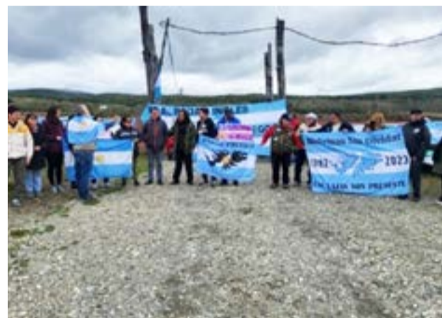
La organización Caravana de los Pueblos volverá a movilizarse hacia la zona de la estancia El Relincho, en Tolhuin, donde se encuentra emplazado el sistema de radarización de origen británico cuya instalación generó —desde 2023— un persistente reclamo social y político en Tierra del Fuego.

La nueva caravana reactivará una discusión instalada desde hace más de un año: la presencia y el estatus legal de un sistema de radarización operado por una empresa con vínculos en el Reino Unido en una provincia estratégicamente vinculada al Atlántico Sur, la Antártida y la Cuestión Malvinas. La marcha del 23 de noviembre volverá a poner el tema en la agenda pública, mientras crece la expectativa por una respuesta institucional más detallada y formal.