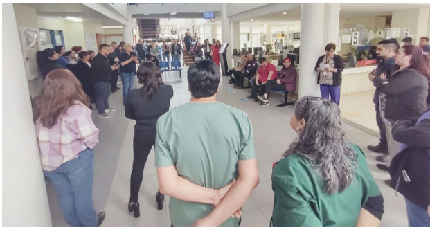
Crece el malestar en los diferentes sectores, por la propuesta salarial del gobierno para los escalafones seco y húmedo. Hoy habrá una nueva mesa salarial.

“Se planteó la necesidad de que los aumentos sean equitativos para todo el personal del esca-