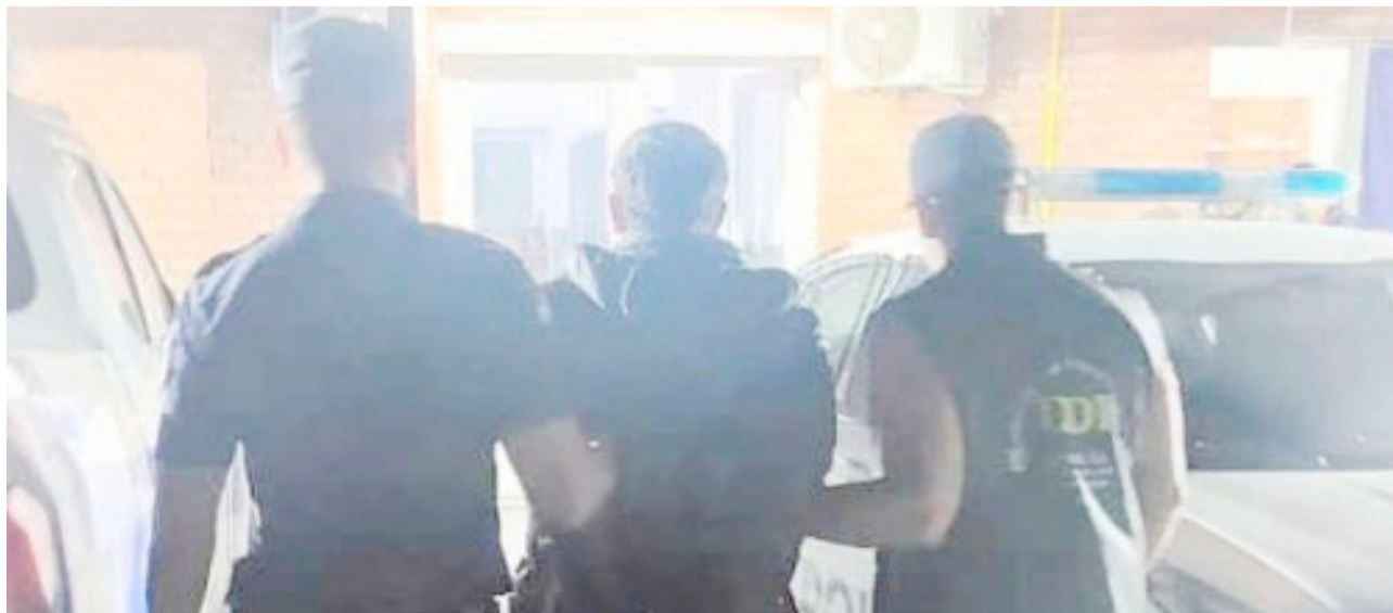
Demoraron en San Luis a un hombre que tenía pedido de captura de la provincia de Tierra del Fuego.