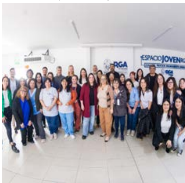
Este evento reunió a diferentes actores estratégicos: equipos técnicos de la Secretaría de Salud, de la Secretaría de Género y Desarrollo Comunitario, así como del área de Juventudes en pos de fortalecer -desde una perspectiva transversal- la lucha contra el VIH.

Grande a la Declaración de París reafirma el compromiso del Municipio con una respuesta integral, basada en derechos y libre de estigmas frente al VIH”. En