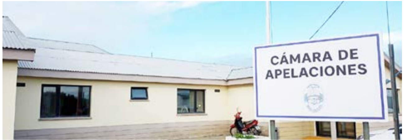
Fallo de Cámara pondera proteger la intimidad digital de un niño en Río Grande.

La sentencia marca un precedente en Tierra del Fuego sobre cómo la justicia aborda la tensión entre libertad