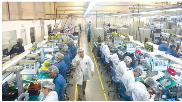
Con la publicación en el Boletín Oficial, se formaliza la pretensión de las empresas de reducir el porcentaje de componentes que deberán ser fabricados en la provincia, para la elaboración de teléfonos celulares

Río Grande - La publicación, luego de los considerandos expresa: “Artículo 1°.- Apruébase la secuencia de operaciones correspondiente al proceso productivo para la fabricación de equipos de radiocomunicaciones móviles celulares, cuya descripción obra en el Anexo (IF-2025-123950594-APN-SSGP#MEC), que forma parte integrante de la presente resolución. El mencionado proceso revestirá el carácter de transformación sustancial en orden a lo establecido en los Artículos 21, inciso b) y 24, inciso a) de la Ley N° 19.640”. Luego dice: “Artículo 2°.- Las empresas que se encontraren produciendo de conformidad con el proceso productivo aprobado por la Resolución N° 66 de fecha 12 de julio de 2018 de la ex Secretaría de Industria del ex Ministerio de Producción, deberán adecuar dicho proceso productivo conforme las previsiones dispuestas en la presente resolución, en un plazo máximo de ciento ochenta (180) días corridos a partir de su entrada en vigencia”.