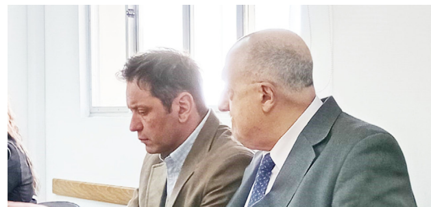
Últimas testimoniales en el juicio por homicidio culposo contra dos médicos y cuarto intermedio hasta el 26 de noviembre cuando comiencen los alegatos.

El Tribunal de Juicio dispuso un cuarto intermedio y fijó para el 26 de noviembre a las 9 horas la instancia de alegatos de las partes acusadoras. Al día siguiente, el 27 de noviembre, será el turno de la defensa y de los demandados civiles, entre ellos la aseguradora y la clínica Cemep.