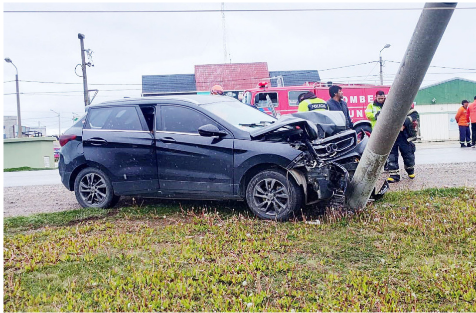
Conductor chocó contra un poste de alumbrado público en calle Echelaine al 800 y resultó lesionado.

Se llevaron a cabo las actuaciones correspondientes en el lugar.