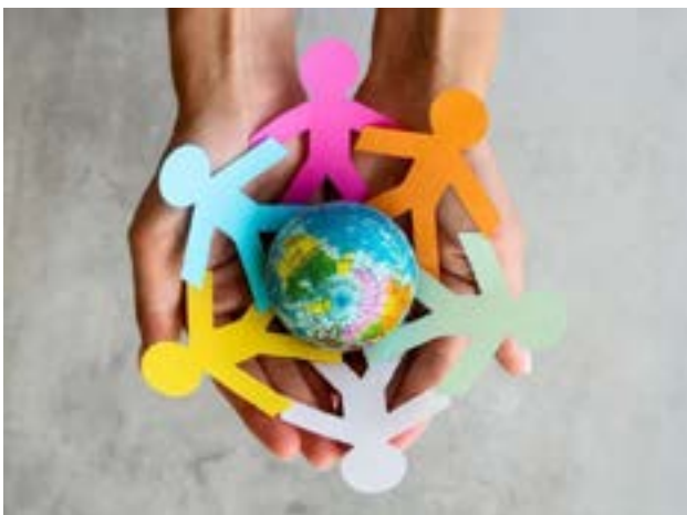
Este espacio busca unir compromisos para la defensa de los Derechos Humanos y la creación del primer archivo de memoria en la provincia, como herramienta de verdad, justicia y formación ciudadana.

Además, el jueves 11 a las 13:00 horas, se llevará a cabo la constitución del Consejo Provincial por la Igualdad y los Derechos Humanos en el Salón Antártida de la Casa de Gobierno. Este nuevo espacio estratégico reunirá a actores institucionales, sociales y académicos para articular agendas en género, prevención de violencias, trata de personas y justicia económica.