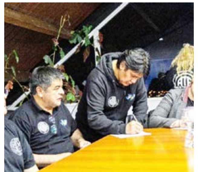
Los gremios con injerencia en la Municipalidad de Ushuaia, a través de un comunicado manifestaron la preocupación que tienen por “la falta de remisión de fondos de coparticipación por parte de la provincia”.

corresponde a Ushuaia es defender la autonomía municipal, el equilibrio institucional y la responsabilidad compartida de todos los actores para preservar la paz social”, concluye el texto.