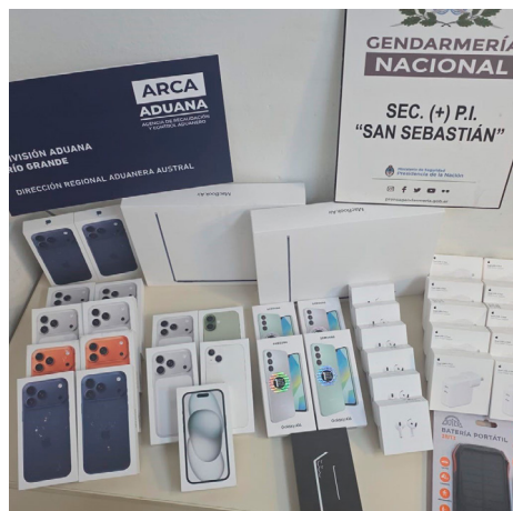
Paso San Sebastián: Incautaron equipos de telefonía y accesorios valuados en más de 45 millones de pesos.

terminar las responsabilidades del caso.