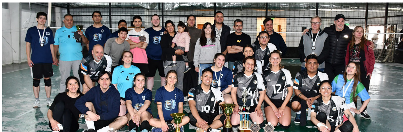
Los equipos de Mala Junta (Campeón) y La Sustancia (Subcampeón) junto a árbitros y la organización del Torneo Provincial del Fuego.

“El vóley mixto no está dentro de la federación, pero nos gustaría tener continuidad. No quedarse quietos, que es lo importante”, remarcaron.