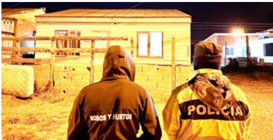
Esclarecen rápidamente el robo de elementos informáticos en Celentano.