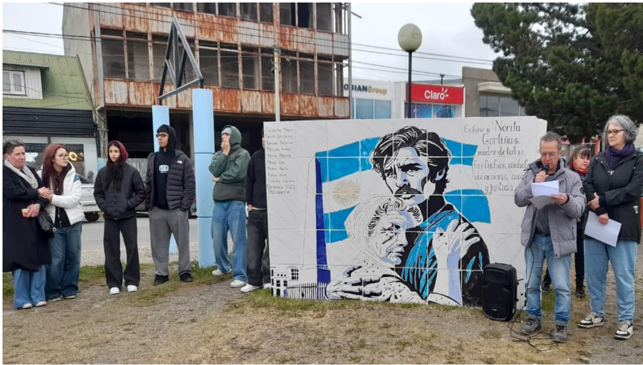
Ayer se inauguró, en Río Grande, un mural recordando la figura de Nora Cortiñas.

“Por eso vemos en estos días la ofensiva legisla-