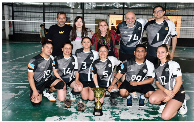
El equipo de Mala Junta, campeón de la segunda edición del "Torneo Provincial del Fuego".