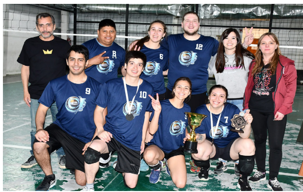
El equipo de La Sustancia, subcampeón de la segunda edición del "Torneo Provincial del Fuego".