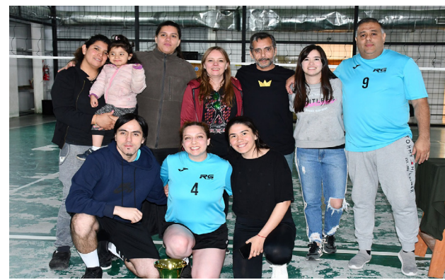
El equipo de Mala Junta Nova, tercer puesto de la segunda edición del "Torneo Provincial del Fuego".

Esta idea responde a una necesidad concreta: ofrecer alternativas reales a quienes desean seguir jugando, entrenando y compartiendo el deporte sin las exigencias del alto rendimiento.