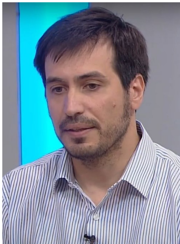
Rayes explicó que el Ejecutivo avanza sobre una agenda de modificaciones estructurales, muchas de ellas ya anticipadas en los lineamientos del denominado Pacto de Mayo.

paga dólares, todo bajo ley argentina y eso es una complicación, porque los inversores internacionales prefieren la ley de Nueva York”.