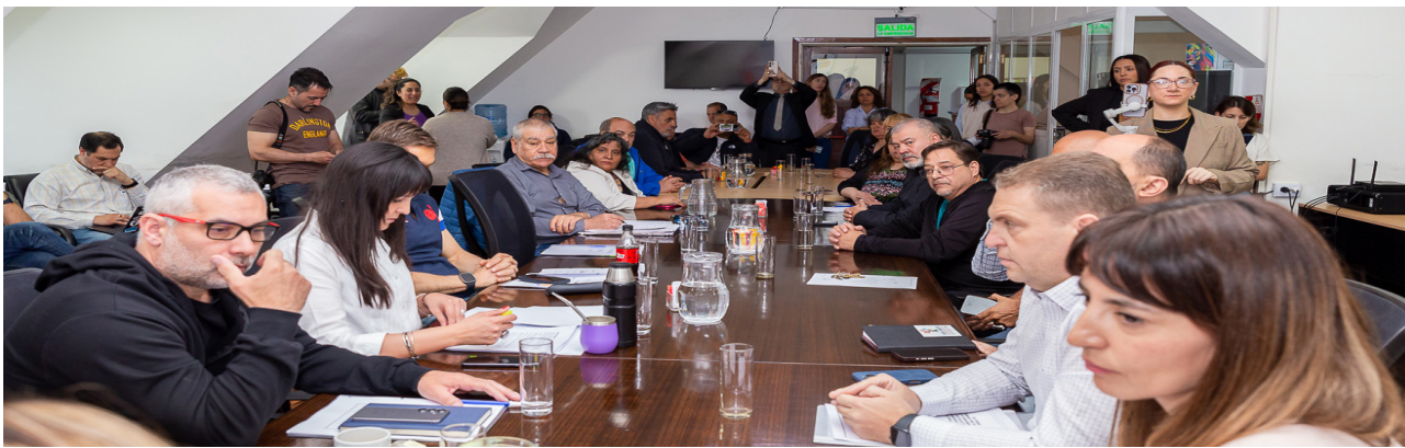
Suspenden Comisión ante la ausencia de autoridades de la Caja Policial.

Para finalizar reconoció que evaluarán los pasos a se-