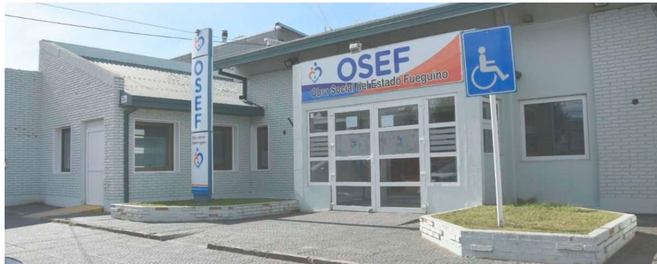
Jubiladas y jubilados que residen en la provincia de Córdoba evalúan iniciar acciones legales contra la OSEF, por la falta de cobertura que tienen después de la designación de una nueva mutual para atenderlos.

Finalmente dijo que, esos afiliados "están pensando, y yo también lo pensé esta mañana cuando obtuve esa respuesta del señor Tomasevich, en ver de tomar acciones legales, porque no se puede tener a una persona cuarenta días sin la cobertura que necesita", concluyó.