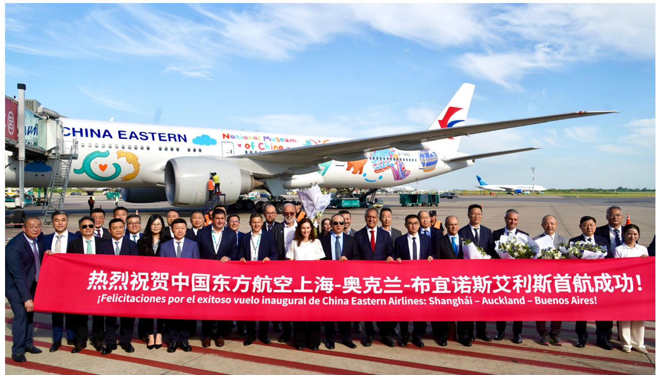
La noticia del primer vuelo inaugural de China Eastern Airlines generó de inmediato expectativa, ya que Argentina logra tener así el vuelo directo más largo a nivel mundial.

Entre enero y octubre de este año, el mercado chino hacia Argentina registró un crecimiento interanual