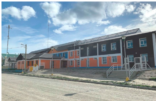
Un padre del Colegio Trejo Noel, que ya tendría antecedentes de hechos violentos, amenazó a un docente delante de un grupo de niños.

esto es grave porque no es solamente en este caso este papá ha sido el desencadenante, y como ya