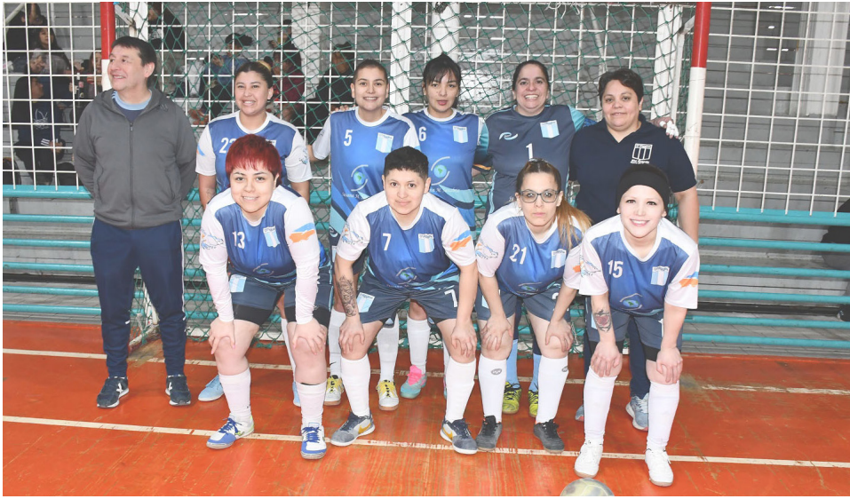
El equipo del Club O'Higgins, primera división "B".