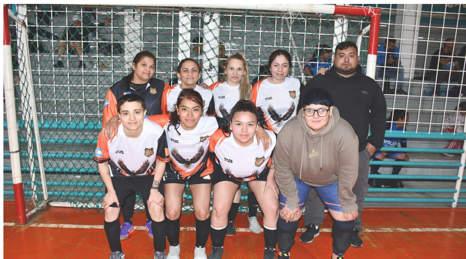
El equipo de Águilas del Sur, primera división "A".