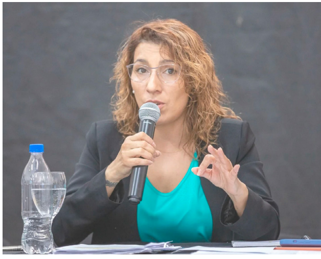
La Secretaria de Obras Públicas del Municipio describió el escenario financiero actual, explicó el plan de acción para 2026 y defendió la modalidad de trabajo conjunto con vecinos y comerciantes. También detalló el avance de obras nacionales pendientes, la situación del FAMP y el acompañamiento municipal a la futura ampliación de la pista del aeropuerto local.

Finalmente, sobre los servicios de la ciudad, Mónaco precisó que “más del 95% de la ciudad cuenta con servicios básicos realizados. Si por hoy hay personas que no tienen los servicios dentro de su casa no quiere decir que no estén las redes”.