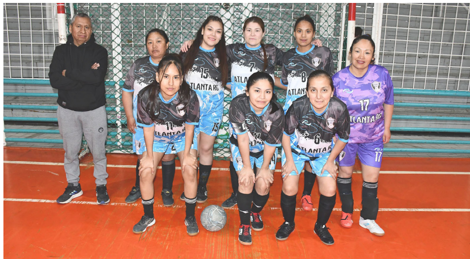
El equipo de Atlanta, primera división "B".