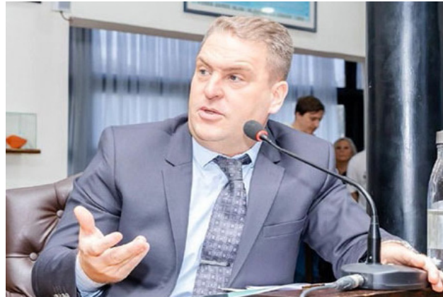
“La ministra tendría que tomarse un ratito para ir a la Legislatura y explicar lo mismo que explican los medios”, dijo el legislador Von der Thusen.

Sobre el acuerdo, remarcó que se necesitan precisiones técnicas y económicas y remarcó que “queremos saber qué empresas se asociarían para la explotación, cómo se calcularon los pasivos ambientales, y qué condiciones tendrá la provincia para operar pozos maduros. Porque Terra Ignis no tiene la capacidad técnicas ni económicas para llevar adelante esta explotación”.