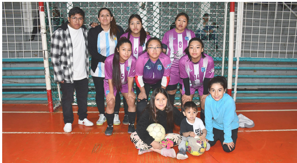
El equipo de Libertad, primera división "A".

"Queremos terminar el año de manera impecable, como lo venimos haciendo fecha tras fecha", señaló. La planificación, la disciplina y la responsabilidad fueron claves para sostener un calendario anual cargado de actividad.