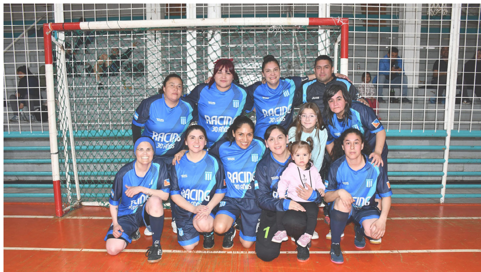
El equipo del Club Racing, primera división "A".

Este enfoque demuestra la línea institucional con la que la Asociación viene trabajando desde hace años: