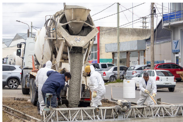
“Los frentistas, los comerciantes ponen el hormigón y nosotros ponemos la logística, el recurso humano, la maquinaria, el desarrollo técnico del trabajo”, explicó.

Además, subrayó que mantener lo ya construido es tan importante como avanzar en obras nuevas, y