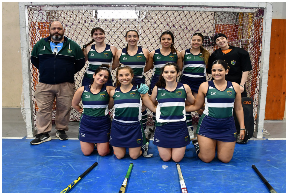
El equipo de CCDS Verde, categoría Primera Damas.