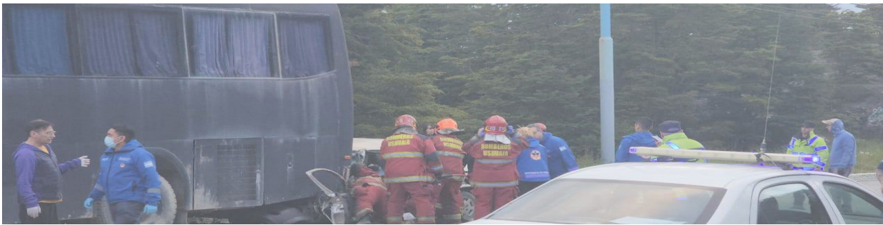
Conductor murió tras chocar contra un colectivo en desuso estacionado en calles Alem y Las Lajas de Ushuaia.

Interviene en el caso el Juzgado de turno, que dispuso la realización de las actuaciones de rigor a fin de determinar las causas del siniestro y establecer o descartar eventuales responsabilidades