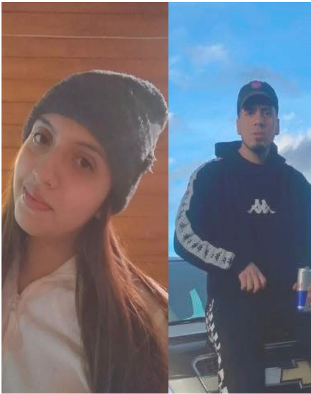
Mueren dos jóvenes en rutas chilenas y uno de ellos era nacido en Ushuaia.