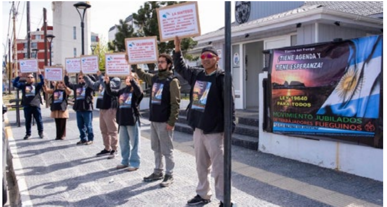
El Movimiento de Trabajadores, Jubilados y Estudiantes Universitarios emitió un extenso documento, donde vuelven a reclamar que la sociedad de conjunto sea beneficiaria de la Ley de Promoción.

El Movimiento de Trabajadores, Jubilados y Estudiantes, termina el documento con una serie de preguntas que proponen debatir; entre ellas: “¿Cuál es la política económica que beneficia o perjudica, al pueblo fueguino? ¿Por qué Tierra del Fuego, es la provincia con el costo de vida más alto del país, siendo la única