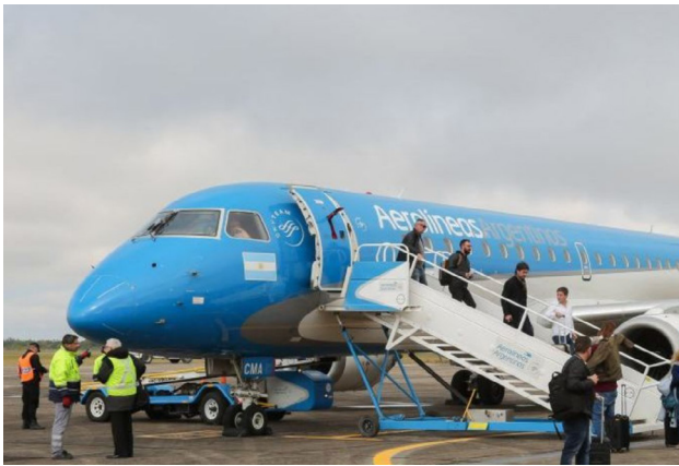
El Gobierno Nacional dictó la conciliación obligatoria y garantizó la normal operación de los vuelos en todo el país durante Navidad y Año Nuevo.

nunciaron una fuerte pérdida del poder adquisitivo frente a la inflación y exigían una recomposición de haberes que no logró resolverse en las instancias paritarias previas.