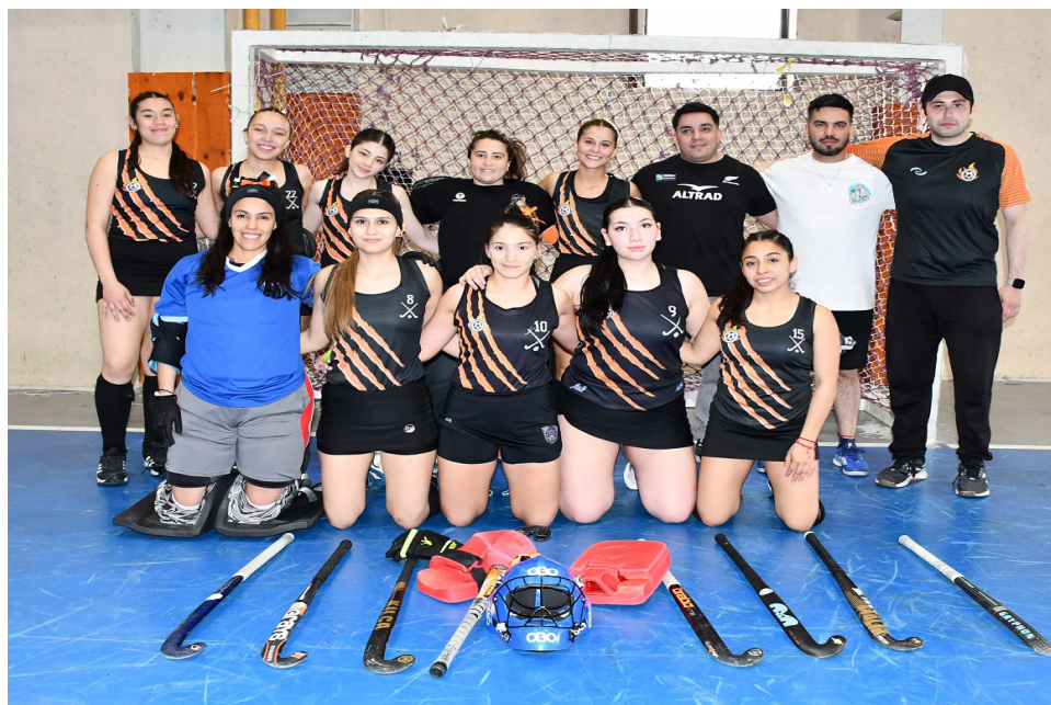
El equipo de ADEFU, categoría Primera Damas.

Otros seleccionados en proceso formativo finalizaron