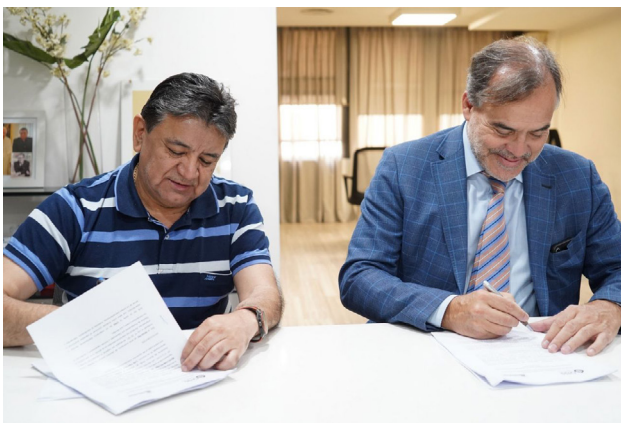
El Registro Nacional de Trabajadores Rurales y Empleadores (RENATRE) y la Organización Iberoamericana de Seguridad Social (OISS) firmaron un Convenio de Capacitación.

Esto, contempla el abordaje sobre el sistema previsional argentino y la seguridad social como bases del tra-