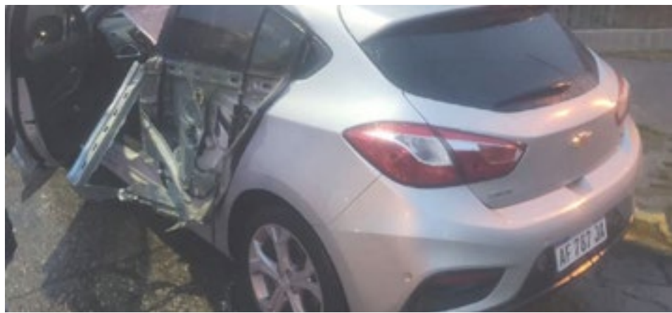
Violento choque en Fuegia Basket y Torelli dejó cuantiosos daños materiales.