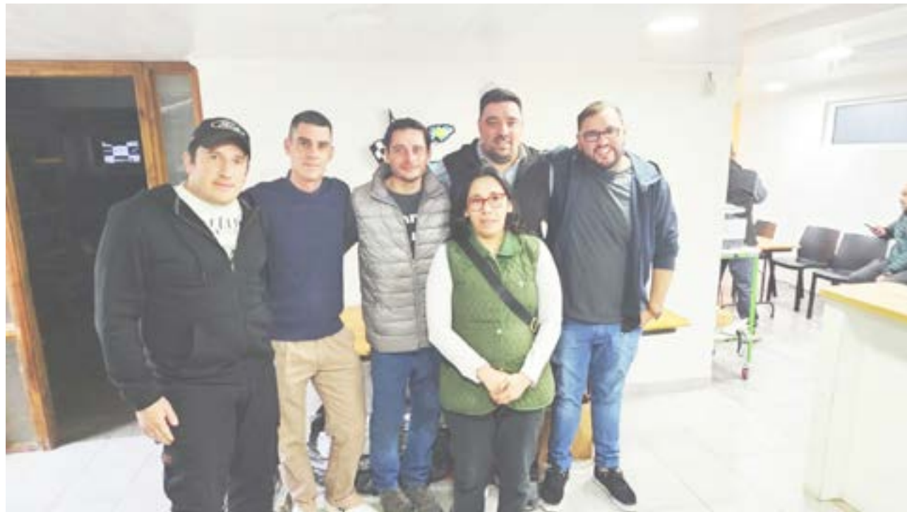
La nueva comisión directiva de (APITUR) ya coordina con las y los corredores fueguinos el cronograma de actividades provinciales con respecto a la temporada 2026.

Con esta renovación institucional, APITUR inicia una nueva etapa con el objetivo de fortalecer la organización del rally provincial, una disciplina con fuerte arraigo en Tierra del Fuego y una extensa trayectoria dentro del deporte motor local.