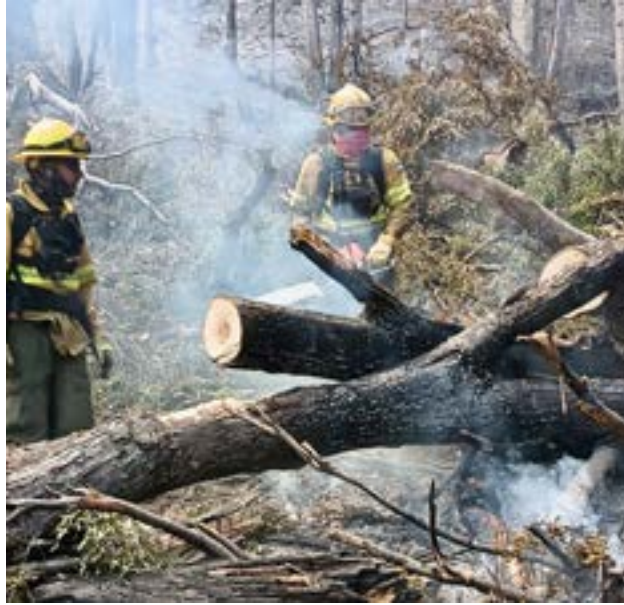
El Gobierno de la Provincia de Tierra del Fuego dispuso el envío de dos brigadistas del Servicio Provincial de Manejo del Fuego para colaborar en el combate del incendio "Puerto Café".

Cía también subrayó el trabajo articulado con Parques Nacionales y agradeció la coordinación logís-