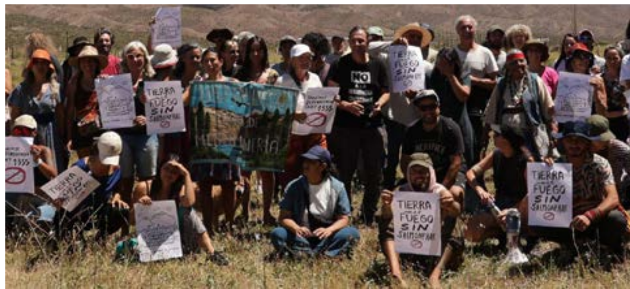
Integrantes de la Asamblea Comunidad Costera de Tierra del Fuego Antártida e Islas del Atlántico Sur, participaron activamente del 5° Festival Pueblos Puentes de Agua, que se llevó adelante en la localidad mendocina de Uspallata.

Para concluir, Carla Wichmann señaló que “como leía en alguno de los carteles que hay en este en este festival y en el mural que se hizo en el marco del festival, hay una frase preciosa, que ya también la hemos recuperado en otros en otros diálogos que tuvimos, que dice: somos naturaleza defendiéndose. Y eso somos, y eso estamos haciendo, por eso, Tierra del Fuego está presente en el quinto Festival para los Pueblos Puentes de Agua” expresó la representante de la Asamblea Comunidad Costera AeIAS.