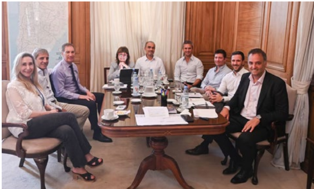
El Gobierno decidió retirar el artículo 44 de la ley de reforma laboral, tras la fuerte presión y rechazo de los bloques aliados a la limitación de las licencias médicas que había sido aprobada en el debate en la Cámara de Senadores.

El retiro del artículo no implicó, según se explicó, la renuncia definitiva a debatir cambios en materia de licencias. Algunos referentes legislativos antici-