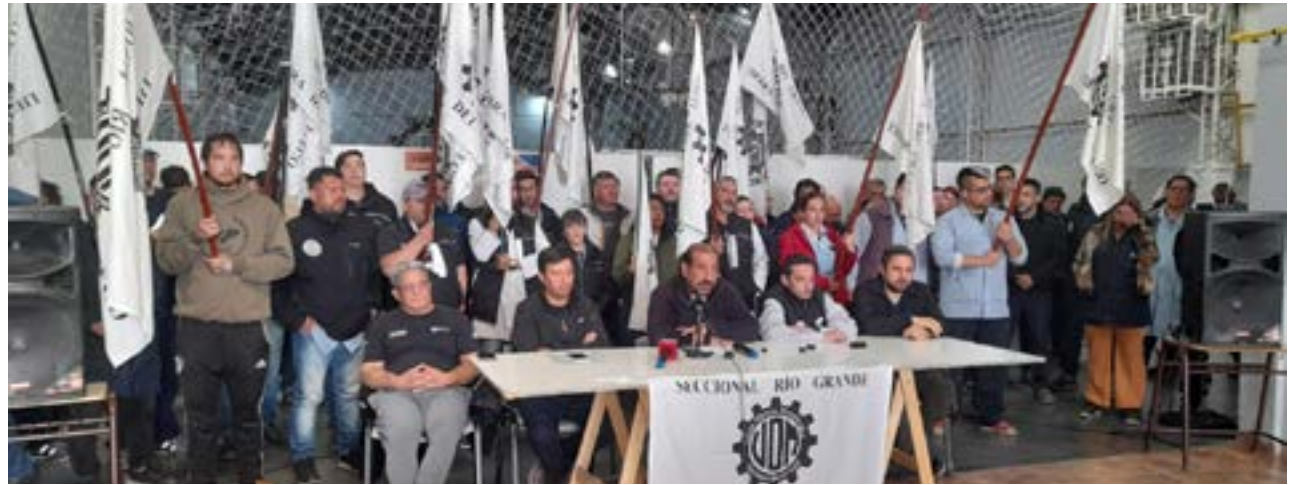
En conferencia de prensa, la seccional Río Grande de la UOM confirmó su adhesión al paro y una manifestación a la cual convocaron “a todos los sectores que quieran adherir”, para hoy a las 11:30 en la Plaza de las Américas.

con la vida de compañeros y compañeras que nos han antecedido para poder lograr beneficios tan importantes como la ley 2744, el convenio colectivo de trabajo, la ley 14250, que es la que rige las paritarias libres, la ley de asociaciones sindicales, entre tantas otras”.