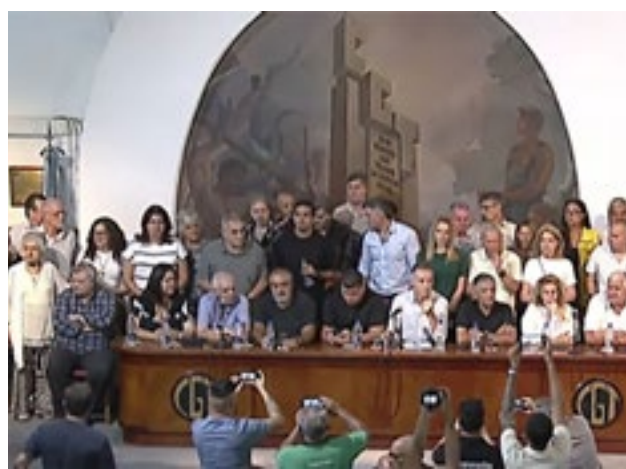
La CGT confirmó el paro general de 24 horas previsto para este jueves, cuando la Cámara de Diputados tiene previsto tratar la reforma laboral de Javier Milei, y, tras asegurar que “no se entregarán las conquistas laborales”, advirtió: “Este es el comienzo”.

Rechazó la “promesa futura” de creación de empleo genuino que asegura el Gobierno a cambio de la pérdida de derechos actuales que ocasionaría la reforma laboral, calificándola como “demasiado costosa” e “incumplida”, y resaltó la inconstitucionalidad del proyecto, al juzgar que “atenta contra el principio protectorio del derecho