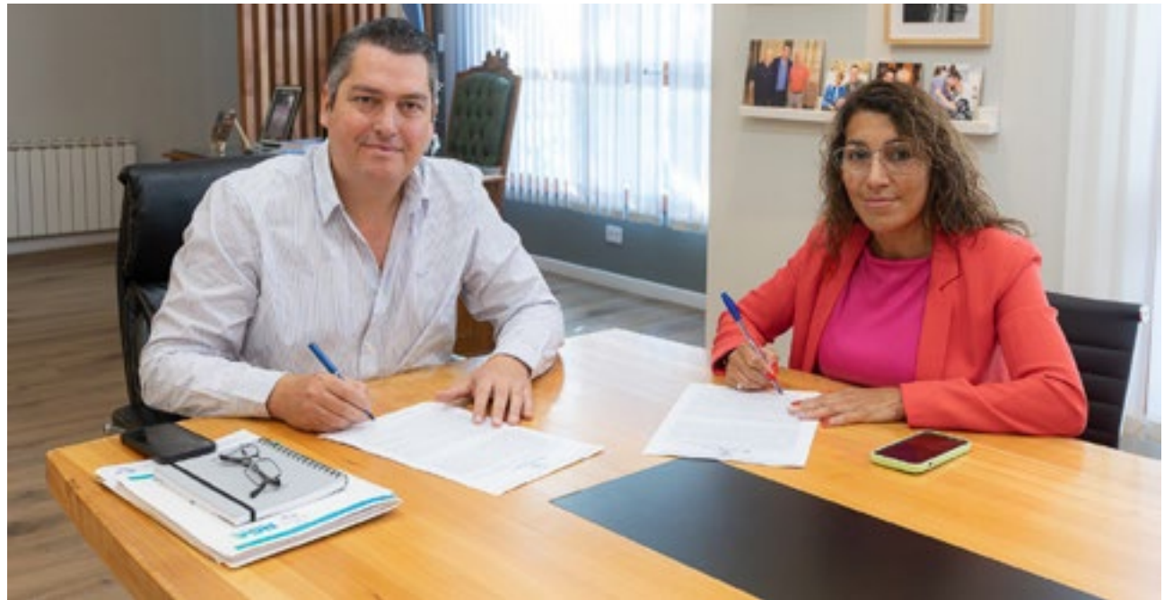
La obra contempla, en esta primera instancia, la pavimentación de 380 metros lineales de esta arteria, desde Vuelta de Obligado hacia el norte en dirección al barrio De Las Aves.

La gestión del intendente Martín Pérez continúa trabajando