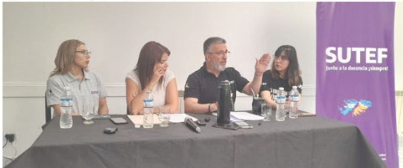
El sindicato docente brindó una conferencia de prensa este miércoles, donde puntualizaron todas las cuestiones que están sin resolverse para un comienzo de clases armonioso.

Además, mencionó otras instituciones con proble-