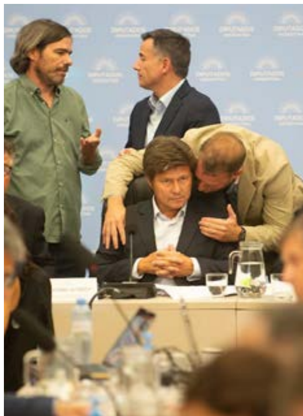
El oficialismo logró este miércoles avanzar con el dictamen de mayoría del proyecto de modernización laboral en un plenario de las comisiones de Legislación del Trabajo y Presupuesto y Hacienda de la Cámara de Diputados. La sesión será este jueves a partir de las 14 y los libertarios tienen prácticamente asegurado el quórum.

Hasta el momento, el FAL cosechó el rechazo de diferentes bloques aliados y dialoguistas, principalmente por en las provincias rechazan la desfinanciación de la ANSES. Provincias Unidas, Innovación Federal, los tucumanos de Independencia y los ca-