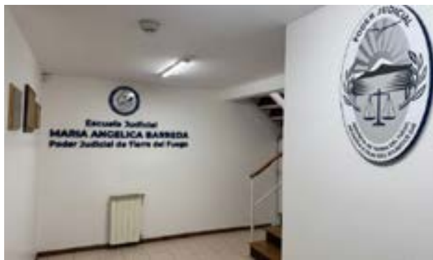
La oferta formativa estuvo orientada principalmente al nivel inicial, lo que representó el 97,67% de los cursos dictados, con un enfoque transversal.

Ushuaia. - La oferta formativa estuvo orientada principalmente al nivel inicial, lo que representó el 97,67% de los cursos dictados, con un enfoque transversal que buscó garantizar el acceso a herramientas básicas de capacitación para todo el personal, independientemente de su escalafón o especialidad. En ese marco, predominaron las temáticas categorizadas como "generales" (60,47%), por sobre las propuestas específicas por fuero. Cerca del 70% de los cursos se desarrollaron bajo modalidad presencial, formato que permitió sostener la participación y el compromiso del alumnado. En cuanto a la distribución territorial, el 68,75% de las actividades se concentraron en la ciudad de Ushuaia, lo que plantea el desafío de ampliar la llegada de las capacitaciones a Río Grande y Tolhuin en los próximos ciclos lectivos. Entre los ejes temáticos que concentraron mayor interés