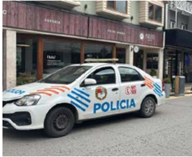
Interno con salidas transitorias fue detenido por intento de hurto en pleno centro de Ushuaia