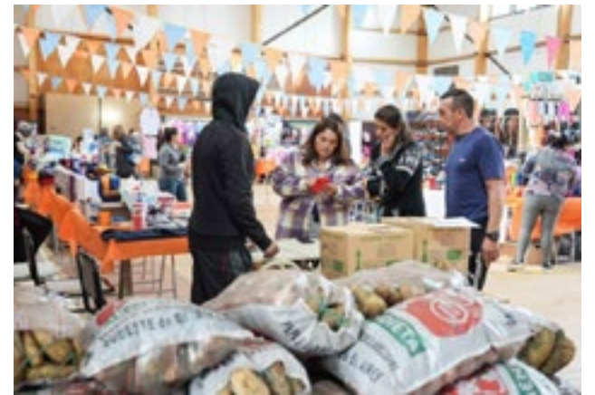
La iniciativa busca descentralizar las áreas de Gobierno y trasladar servicios a distintos barrios de las ciudades de Río Grande, Ushuaia y Tolhuin.

distintos sectores de la provincia y facilitando el acceso a trámites y servicios en el propio barrio, de manera ágil y gratuita. La iniciativa se llevará a cabo una vez por mes durante todo el año.