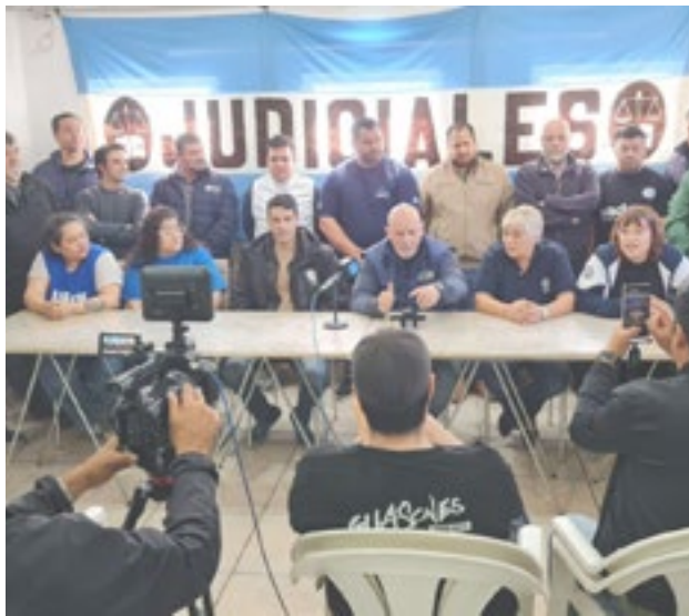
En el marco de una fuerte adhesión al paro, la central obrera realizó una conferencia de prensa en el quincho de la UEJN en Río Grande.

“Si te enfermás en vacaciones, hoy la ley permite suspender el período y retomarlo después. Con esta reforma, te