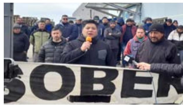
Piden la intervención de los ministerios de Trabajo y Producción de la provincia y denunciaron que la patronal no responde a los llamados. Hay temor por la continuidad de la fuente laboral.

En conferencia de prensa, la conducción de la UOM Río Grande y el cuerpo de delegados de la empresa Aires del Sur, confirmó que permanecerán dentro de la planta reclamando una solución para la situación que están atravesando.