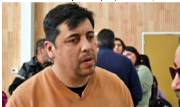
“Estamos la verdad que contentos por cómo viene creciendo Tolhuin en materia de turismo”, valoró Harrington.

Consultado sobre posibles concesiones, aclaró que no se prevé entregar la totalidad del predio a un único privado. “Creo que sería un gran error concesionar 500 hectáreas a una sola persona porque sería imposible a