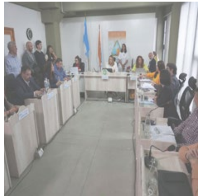
En una sesión extraordinaria que dejó definiciones clave en materia tributaria y de infraestructura, el Concejo Deliberante de Ushuaia sancionó la prórroga de los descuentos del 10% y 15% aplicables al pago anual de distintos tributos municipales, al tiempo que dio luz verde a nuevas obras bajo el régimen de contribución por mejoras.

Mientras se sostiene el discurso de alivio impositivo para quienes cumplen, también se avanza en proyectos que requieren financiamiento compartido. La discusión de fondo, cómo equilibrar recaudación, incentivos y obra pública, seguirá siendo central en la agenda política lo-