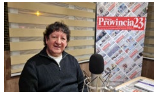
Gallardo aseguró que “mantuvo conversaciones con el Poder Ejecutivo provincial y que existe una definición política favorable, es muy probable que en los próximos días se apruebe, así como se hizo con la acuicultura, lo mismo va a pasar con el RIGI”, resaltó.

Frente a las críticas que plantean que el RIGI implica ceder soberanía, respondió que “toda la deuda argentina siempre se rigió por tribunales internacionales, no es nuevo, lo que se busca es previsibilidad”, aseveró. Para Gallardo, la discusión de fondo es cómo generar