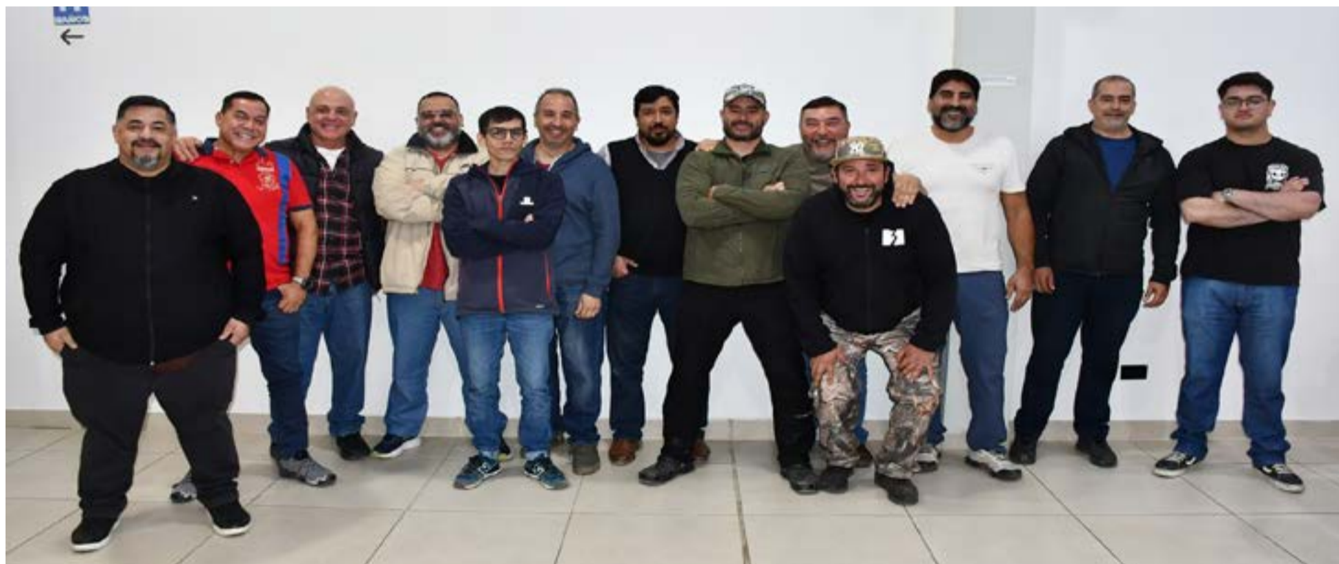
La comisión directiva de la Asociación de Tiro Deportivo de la Provincia de Tierra del Fuego se reunió con sus socios y los nuevos legítimos usuarios que se sumaron a la institución para delinear el calendario deportivo del año 2026.

"Ya veníamos estos fines de semana juntándonos, comenzando el año con las actividades. Estamos con-