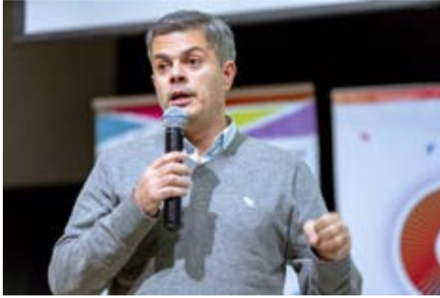
El pronunciamiento del Gobierno Provincial cuenta con el acompañamiento de los Presidentes de los Centros de Veteranos de Guerra de Malvinas de Ushuaia y Río Grande.

Cabe destacar que el pronunciamiento del Gobierno Provincial cuenta con el acompañamiento de los