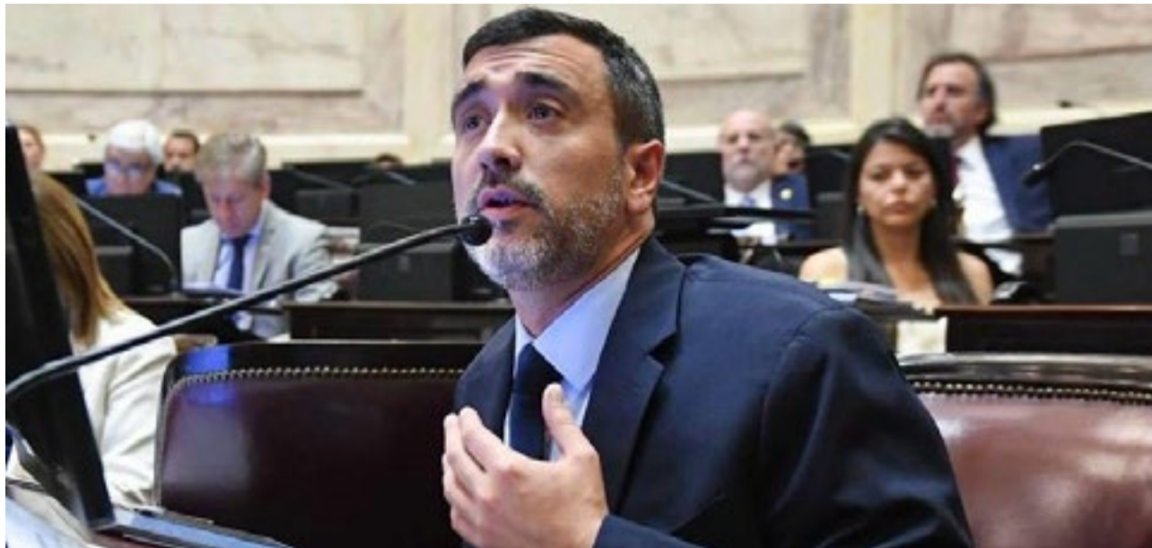
El senador nacional Agustín Coto remarcó que la iniciativa mantiene intacta la protección de glaciares y ambientes periglaciares que actúan como reservas hídricas, así como el Inventario Nacional de Glaciares incorporando el rol activo de las provincias.

“Sin reglas claras no hay desarrollo -subrayó Agustín Coto-. Esta media sanción corrige deficiencias técnicas, aporta previsibilidad y seguridad jurídica, y fortalece el federalismo que la Argentina necesita”, sentenció.