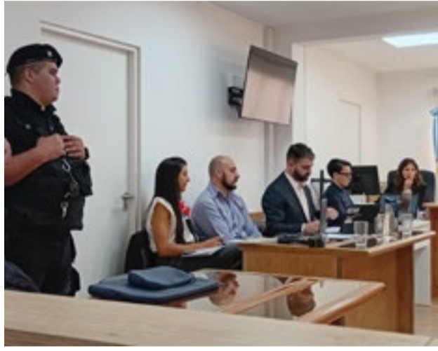
La Fiscal Zárate de Tolhuin pidió 15 años de prisión en un caso de violencia de género y privación ilegítima de la libertad.

Desde una mirada de género, la fiscal contextualizó la contradicción de la víctima que desmintió los