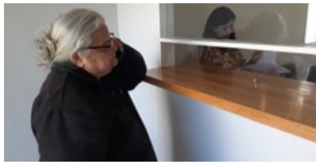
En Río Grande y Ushuaia, jubiladas y jubilados estuvieron recolectando firmas para reclamar una serie de medidas por la situación de la obra social.

Destacando que "el amparo queremos hacerlo en forma colectiva, de todos los compañeros, allí pedimos la restitución, como dije recién, de toda esta situación de salud, como ser medicación, también las especialidades que no hay, principalmente la de salud mental, la de psicólogo, psiquiatra, fonoau-