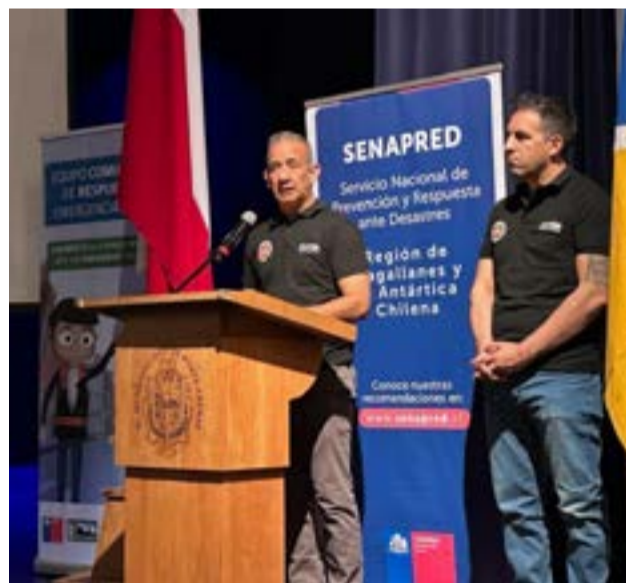
tártida, Islas del Atlántico Sur y Asuntos Internacionales.

y Respuesta ante Desastres (SENAPRED) de la Región de Magallanes, junto a la Secretaría de Malvinas, An-