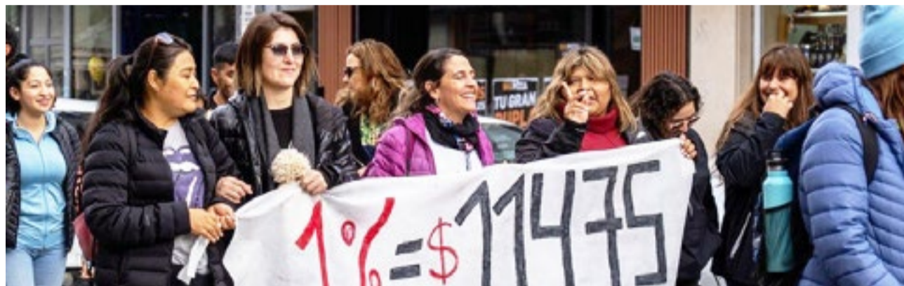
Este lunes 30 de marzo se llevó adelante el Congreso Provincial virtual con la participación de más de 140 delegadas, delegados e integrantes de comisiones directivas de SUTEF, con lectura de mandatos y se resolvió una agenda con acciones gremiales desde el 31 de marzo al viernes 10 de abril.

¡Sigamos fortaleciendo la unidad y la lucha de la docencia fueguina! Repudiamos la propuesta salarial del 1%