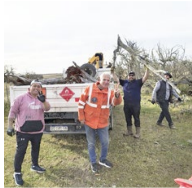
El locro de los petroleros en la Vigilia, una tradición que une memoria y comunidad.

Mientras tanto, el sector petrolero observa con atención un escenario económico complejo, intentando sostener el empleo en medio de un país atravesado por la incertidumbre.