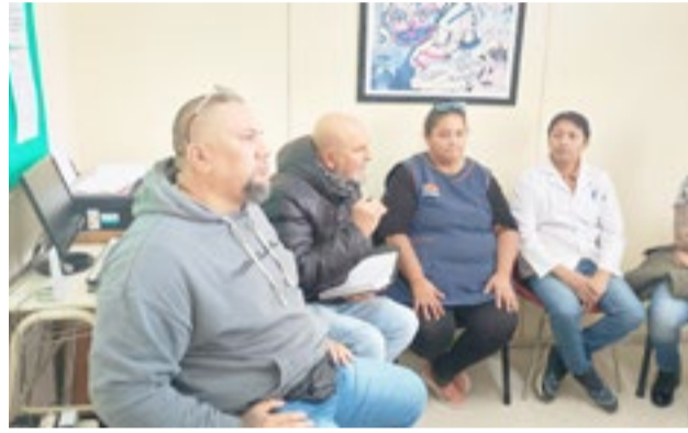
Integrantes de la CTA Autónoma y de ATE estuvieron en la Escuela 14 de Río Grande, preocupados por la situación del personal POMyS.

bién que "en este caso se dieron algunos traslados compulsivos como castigo, entonces hemos podido trabajar sobre ese tema. Los directivos de las escuelas reconocen que no hay elementos para cumplir con las normas de higiene, seguridad y riesgo del trabajo, pero también se dan otros casos en los comedores donde también hay falta de elementos y de artículos para no solamente llevar la higiene, sino también para la elaboración de los alimentos para los niños y no tienen como para hacer un menú que sustente a esos niños", aseguró.