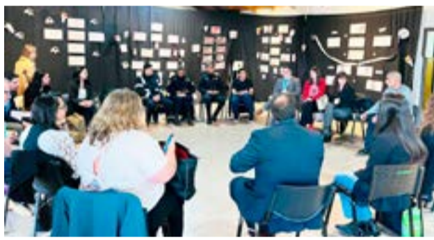
El Poder Judicial encabezó una reunión de trabajo para fortalecer el abordaje de situaciones de violencia en Tolhuin.

Durante la reunión se dio continuidad a una línea de trabajo iniciada en noviembre, en la que se habían establecido pautas de funcionamiento para el abordaje de las violencias en la ciudad. En ese marco, se avanzó en la implementación de un circuito de intervención