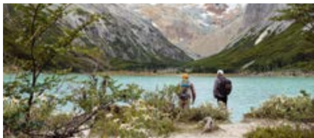
El titular del INFUETUR subrayó que las iniciativas buscan adaptar el marco normativo a la evolución que ha tenido la actividad en los últimos años, incorporando nuevas prácticas, modalidades de comercialización y mayores exigencias en materia de seguridad y sostenibilidad.

Río Grande. -En ese sentido, el titular del INFUETUR subrayó que las iniciativas buscan adaptar el marco normativo a la evolución que ha tenido la actividad