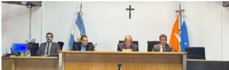
Comenzó juicio de abuso sexual en Ushuaia.

Los sucesos habrían ocurrido el pasado 10 de enero del 2022, después de las 3 de