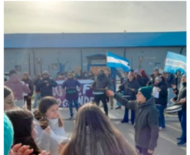
El SUTEF marcó presencia en el lugar donde se realizó el acto de lanzamiento de Terra Ignis Energía S.A. y la presentación del acuerdo operativo con Velitec S.A.

de la provincia, donde se discute el futuro de recursos clave. Queremos saber cómo se va a distribuir esa riqueza, qué va a llegar a educación y a salud, y cómo se va a salir de esta situación”, expresó. Indicando que “En cualquier sociedad capitalista, en Argentina o en Europa, la redistribución se hace a través de impuestos”.