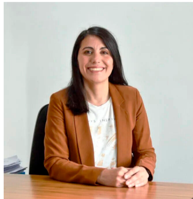
La secretaria de Gobierno Municipal expuso un diagnóstico crítico sobre la situación económica y social de Tolhuin.

En materia energética, Cejas reconoció mejoras parciales tras dificultades previas y expresó que "se ha generado una suerte de mejoramiento con lo que tenía que ver con el servicio de los motores y en el