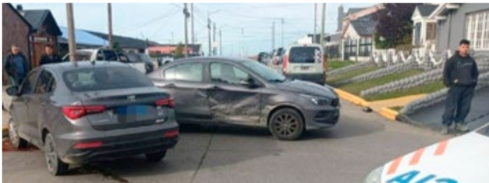
Colisión en Ushuaia y Buenos Aires dejó una mujer con lesiones leves.

Río Grande. - Este miércoles, personal de la Comisaría Tercera intervino en la intersección de las calles Ushuaia y ambulancia al hospital para una evaluación integral. Allí recibió el alta médica con diagnóstico de lesiones leves. En