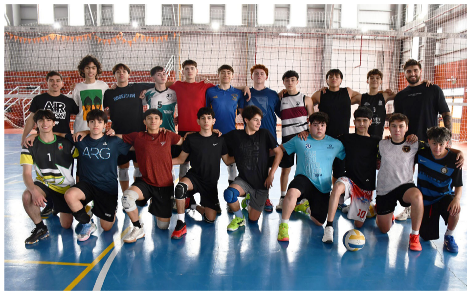
La selección fueguina de vóley masculina, categoría sub-16.