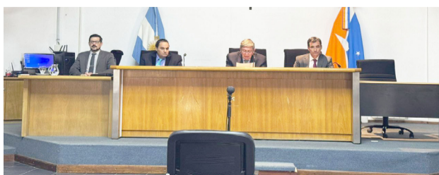
Sujeto llega a debate oral en Ushuaia por el abuso sexual de su hija biológica.

Ushuaia. - El hombre está acusado de haber abusado sexualmente, en un número indeterminado de oportunidades, de la hija de quien fuera su pareja (de 16