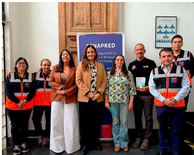
La iniciativa forma parte de la agenda de cooperación descentralizada entre ambos países, un instrumento orientado a promover proyectos conjuntos entre gobiernos subnacionales en áreas estratégicas para el desarrollo territorial.

La propuesta se desarrolla a partir de la convocatoria de cooperación descentralizada impulsada por la Agencia Chilena de Cooperación Internacional para el Desarrollo (AGCID) y por la Dirección Nacional de Cooperación Internacional (DNCIN) del Ministerio de