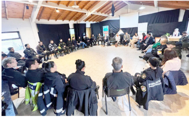
Realizan el cuarto encuentro del ciclo de articulación interinstitucional en Tolhuin para el abordaje de situaciones de violencia.

Posteriormente, se amplió la mesa de trabajo con la participación de organismos interdisciplinarios. Formaron parte representantes del Poder Judicial, el Juzgado de Competencia Integral, el Ministerio Público Fiscal, la Defensa Pública, el Centro de Mediación (CE-