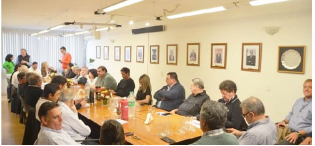
Federacion argentina de la industria maderera FAIMA.

Artículo 5°.- Invitase a las municipalidades a dictar las normas legales pertinentes a los fines de otorgar be-