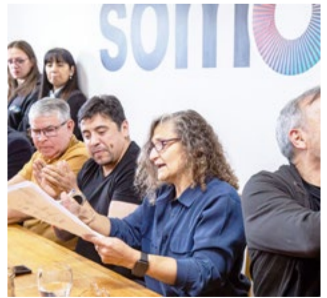
El Gobierno de la Provincia, a través del Ministerio de Trabajo y Empleo, homologó el Convenio Colectivo de Trabajo del Municipio de Tolhuin.