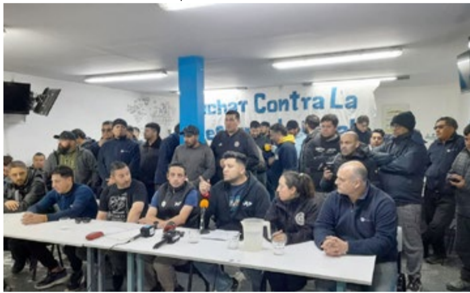
La conducción de la UOM Río Grande, el Congreso de Delegadas y Delegados, el Cuerpo de Delegados y los trabajadores de Aires del Sur, dieron una conferencia de prensa para ratificar que continúa la toma y el reclamo de poner a producir la planta.