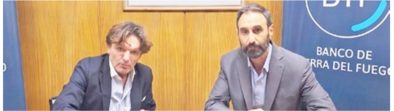
El Banco de Tierra del Fuego (BTF) y el Fondo para la Ampliación de la Matriz Productiva (FAMP) formalizaron un acuerdo para la implementación de un programa de financiamiento orientado al sector productivo provincial.

"Nuestra prioridad es que cada industria y comercio fueguino cuente con el respaldo necesario para proyectar su futuro con solidez. Con estas herramientas, reafirmamos la identidad del BTF como un banco de fomento al servicio