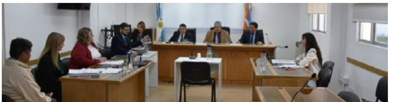
Piden 20 años de prisión para un hombre acusado de abusar de su hijastra en Tolhuin.