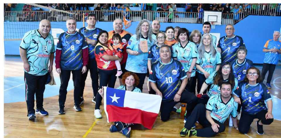
Los equipos de Porvenir (Chile), en las categorías +40 y +50.

Valdés también destacó que estas instancias permiten incorporar nuevas metodologías y mejorar la organización de los equipos, elevando el nivel competitivo de la provincia.