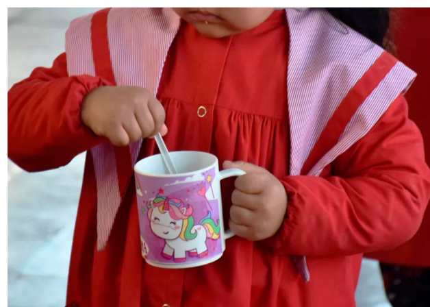
La situación se informó oficialmente, al menos a las instituciones educativas de Río Grande, Tolhuin y las escuelas rurales de la zona.

La situación se informó oficialmente, al menos a las instituciones educativas de Río Grande, Tolhuin y las escuelas rurales de la zona. Se desconoce si la misma problemática se plantea en la zona sur de la provincia. Solamente se garantizará la copa de leche para los jardines de infantes de Río Grande. La falta de leche será entre la semana que va del 27 de abril al 1 de mayo y el servicio podría reestablecerse desde el día 2, cuando se emita una nueva orden de compra.