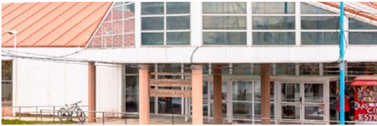
Explosión en planta de hormigón en Ushuaia dejó como saldo a un operario lesionado y hospitalizado.

Se labran las actuaciones correspondientes.