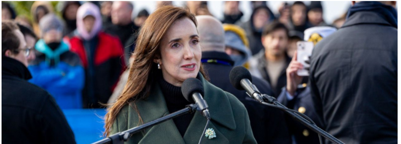
La vicepresidenta Victoria Villarruel redobló la apuesta en el tema Malvinas luego de que trascendieran correos del Pentágono acerca de la posibilidad de que Washington retire el apoyo al Reino Unido por la causa Malvinas.

Y resaltó: “Los kelpers son ingleses que viven en territorio argentino, no son parte de la discusión. Si se sienten ingleses que vuelvan a los miles de kilómetros, donde está su país”.