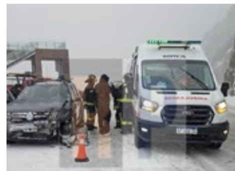
Accidente y una mujer herida en el mirador del paso Garibaldi.