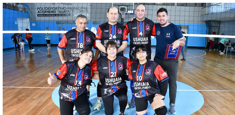
El equipo de Cuervos del Fin del Mundo (Ushuaia), categoría +50.