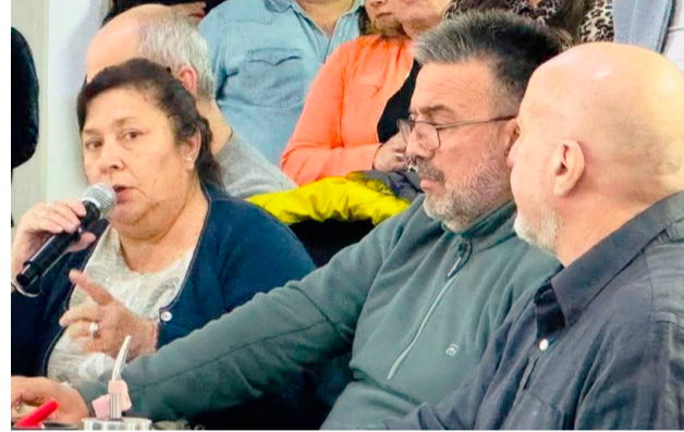
Sobre el final de la semana pasada, se dio un paso decisivo en la lucha por la recuperación de la autarquía de la Obra Social del Estado Fueguino (OSEF).

Por último, se establecen nuevas condiciones para