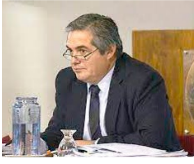
“No se trata de bromas, se trata de delito”, advirtió el fiscal Eduardo Urquiza, respecto de las 60 denuncias por presuntas amenazas en los establecimientos educativos.

Urquiza enfatizó la gravedad de los hechos: “No se trata de bromas como he escuchado por ahí, se trata de delitos. Hay delitos que son muy graves, delitos que pueden establecer responsabilidad penal de menores.”