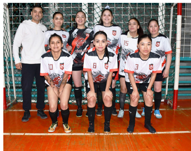
El equipo de Campolter, primera división "B".