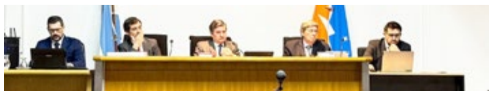
Hombre acusado de la violación de la hija de su pareja fue condenado a 14 años de prisión en Ushuaia.