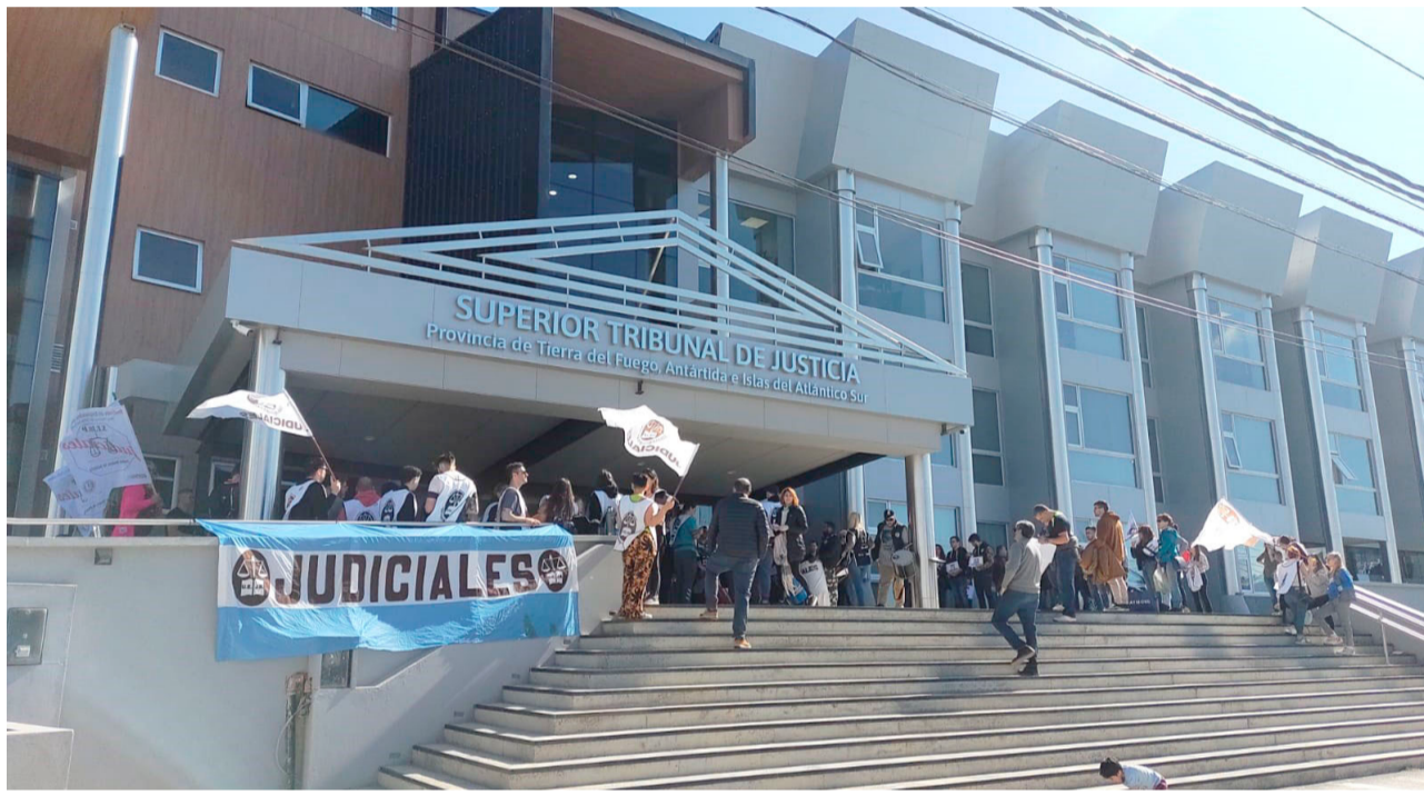
La Unión Empleados de la Justicia de la Nación confirmó un paro de actividades para este martes y miércoles, con una movilización al edificio del Superior Tribunal de Justicia.

Vale mencionar, por último, que también el SEJUP tiene previsto un paro de actividades para este martes y miércoles, aunque en este caso sería sin movilización”.