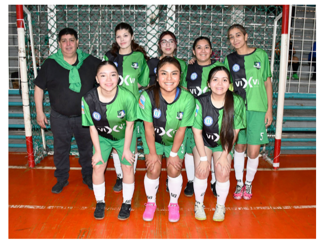
El equipo de Cóndor FC, primera división "B".

Asimismo, agradeció a las jugadoras, a la comunidad del futsal femenino y a los medios que difunden la actividad,