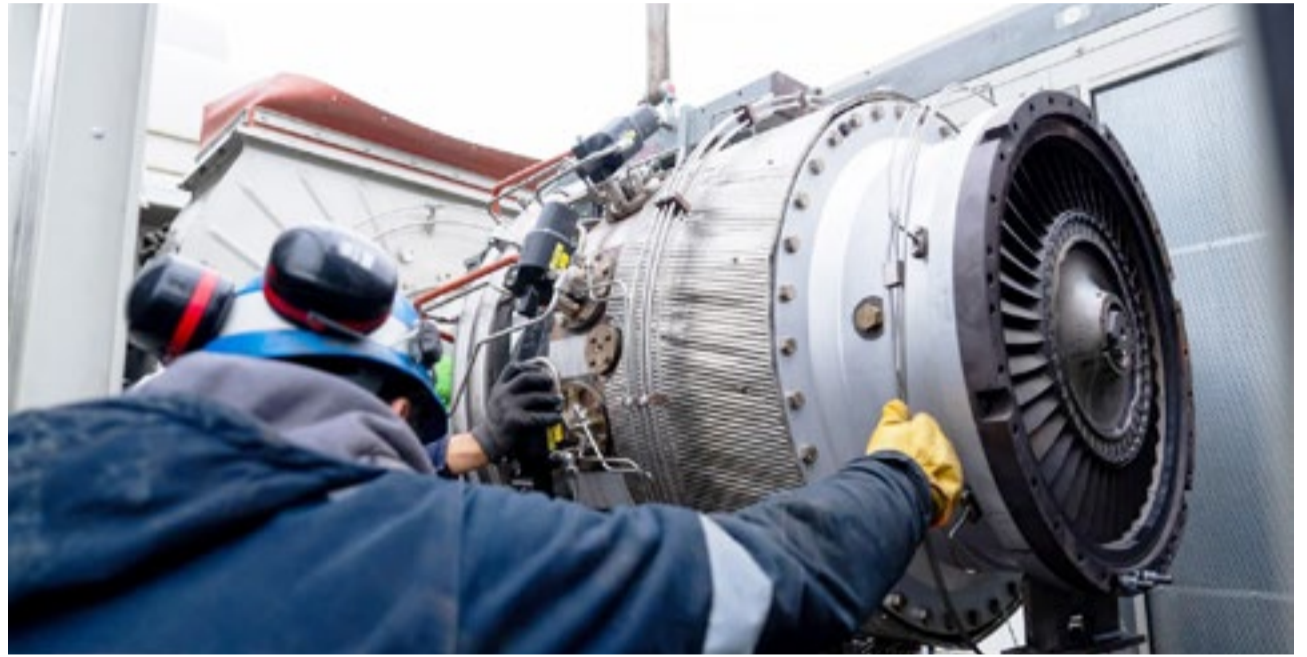
La puesta en funcionamiento de la turbina Taurus 60 marca un avance fundamental en el plan de mantenimiento integral que el Ministerio de Energía y la DPE ejecutan para garantizar la firmeza del suministro local.

con el acompañamiento estratégico del Fondo para la Ampliación de la Matriz Productiva (FAMP), entendiendo que garantizar la disponibilidad de energía