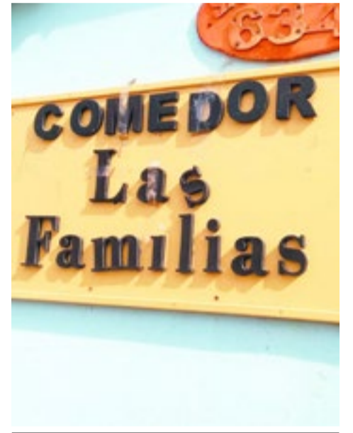
La urgencia ya no se disimula, en el comedor “Las Familias”, ubicado en la Margen Sur de Río Grande, la demanda crece día a día mientras las respuestas escasean.

En un contexto donde la necesidad crece y la ayuda disminuye, el comedor “Las Familias” vuelve a quedar en el centro de una realidad incómoda: cada vez hay más gente que necesita, y cada vez alcanza menos para todos.