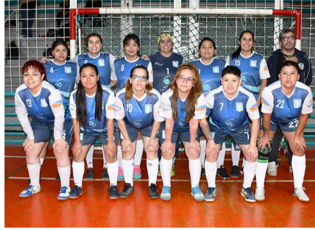
El equipo de O'Higgins, primera división "A".

El inicio del Torneo Apertura es siempre uno de los mo-