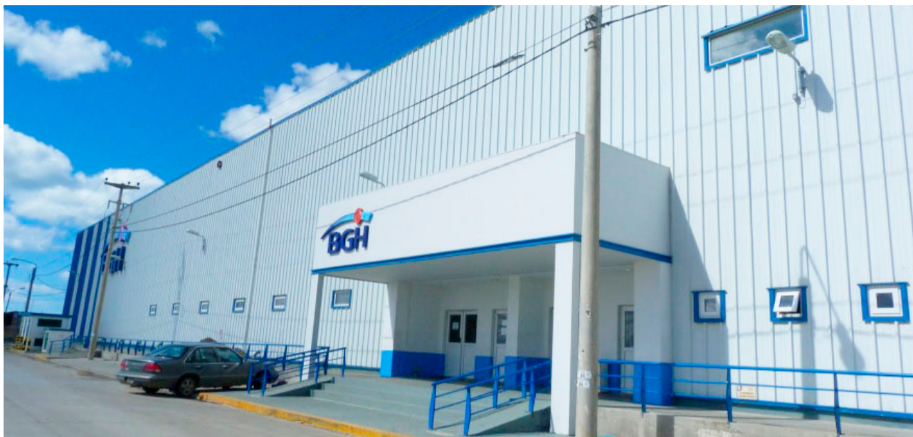
Se pudo confirmar que la empresa BGH avanzaría con una serie de suspensiones o la posibilidad de adelantar las vacaciones de verano al mes de julio, a raíz del sobrestock que tienen y la caída del consumo y las ventas.

Vale mencionar, por último, que esta situación en la empresa BGH podría afectar colateralmente a la Cooperativa Tierra del Fuego (Ex Audivic), a la cual BGH le entrega habitualmente productos para elaborar a fasón.