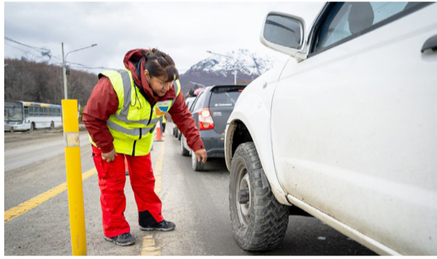
El Gobierno anunció el inicio del Operativo Invierno 2026, que se pondrá en marcha el próximo 15 de mayo con el objetivo de reforzar la seguridad vial y sostener la conectividad en todo el territorio, tal como se lleva adelante cada año.

Al mismo tiempo, se avanza con capacitaciones específicas para el personal que estará afectado al operativo, especialmente en lo vinculado al uso y control de neumáticos de invierno. Las jornadas se realizarán el 29 de abril en Río Grande y el 30 de abril en Ushuaia.