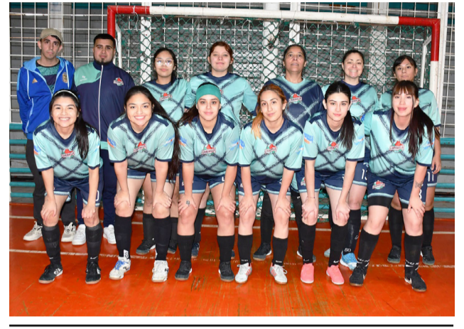
El equipo del Club Garibaldi, primera división "A".

Esta alternativa permite que la competencia continúe creciendo y que más instituciones tengan la oportunidad de participar.