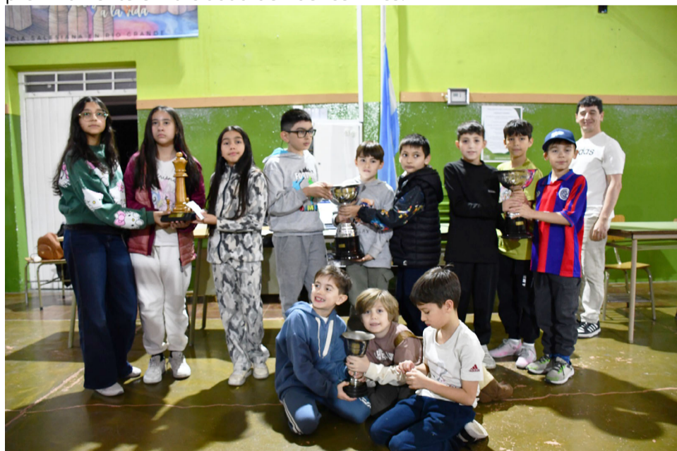
Niñas y niños pertenecientes a varias Escuelas primarias –tanto públicas como privadas– de la ciudad de Río Grande, ocuparon los podios de la nueva edición del Torneo Escolar de Ajedrez que fue clasificatorio para el nacional en Buenos Aires.

El organizador remarcó que la convocatoria no fue sencilla. Las dificultades para ingresar a las escuelas y difundir la propuesta complicaron el trabajo previo, especialmente teniendo en cuenta que estaba destinada a niños de edad primaria, quienes en muchos casos no manejan redes sociales y dependen de la comunicación institucional.