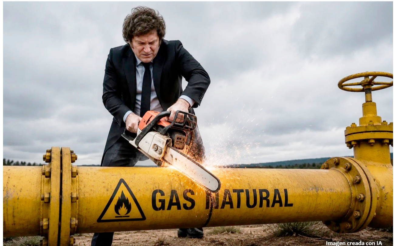
Imagen creada con IA

Finalmente, señaló Martínez sobre la jornada de este martes: "Nosotros creemos que es en defensa propia