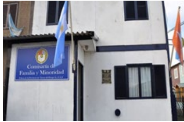
Dictan una restricción de acercamiento de 60 días contra un alto directivo de la Cooperativa Eléctrica por violencia familiar en Río Grande.

Aquella presentación judicial —que también involucra a otros altos directivos por el presunto desvío de recursos y uso irregular de tarjetas corporativas— ha