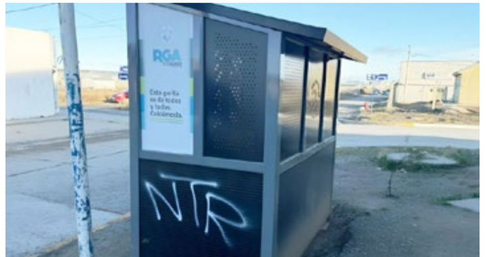
Las estructuras habían sido colocadas recientemente en distintos puntos de la ciudad con el objetivo de brindar espacios de espera más seguros y cómodos para las y los usuarios del transporte público.

Ante esta situación, el Municipio solicita la colaboración de la comunidad para el cuidado y la conservación de estos espacios públicos, promoviendo