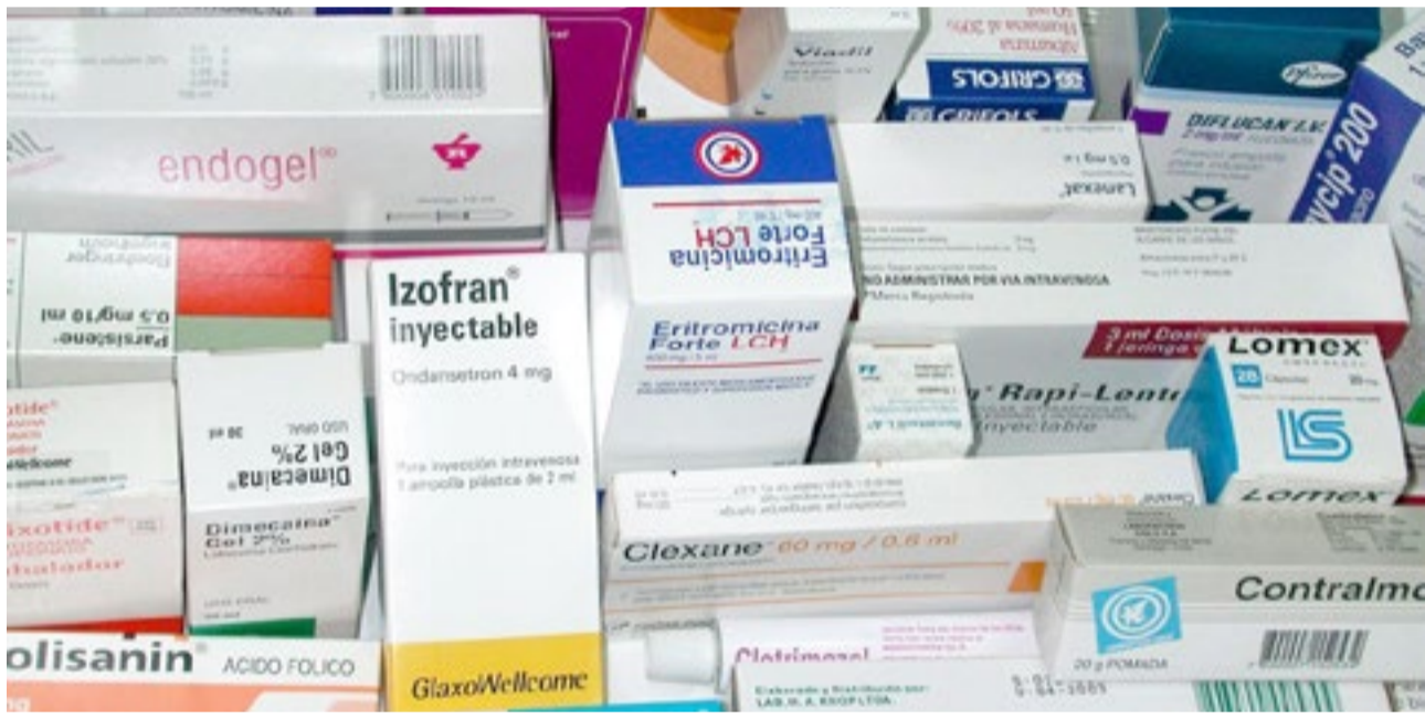
La provincia de Tierra del Fuego finalmente puso en marcha el proyecto provincial de medicamentos fueguinos para cubrir el fuerte retroceso del programa nacional Remediar y garantizar la continuidad de tratamientos esenciales para miles de personas sin obra social ni capacidad de pago.

Además, explicó que “muchas veces existe confusión respecto a la naturaleza del Plan Sumar, no es una