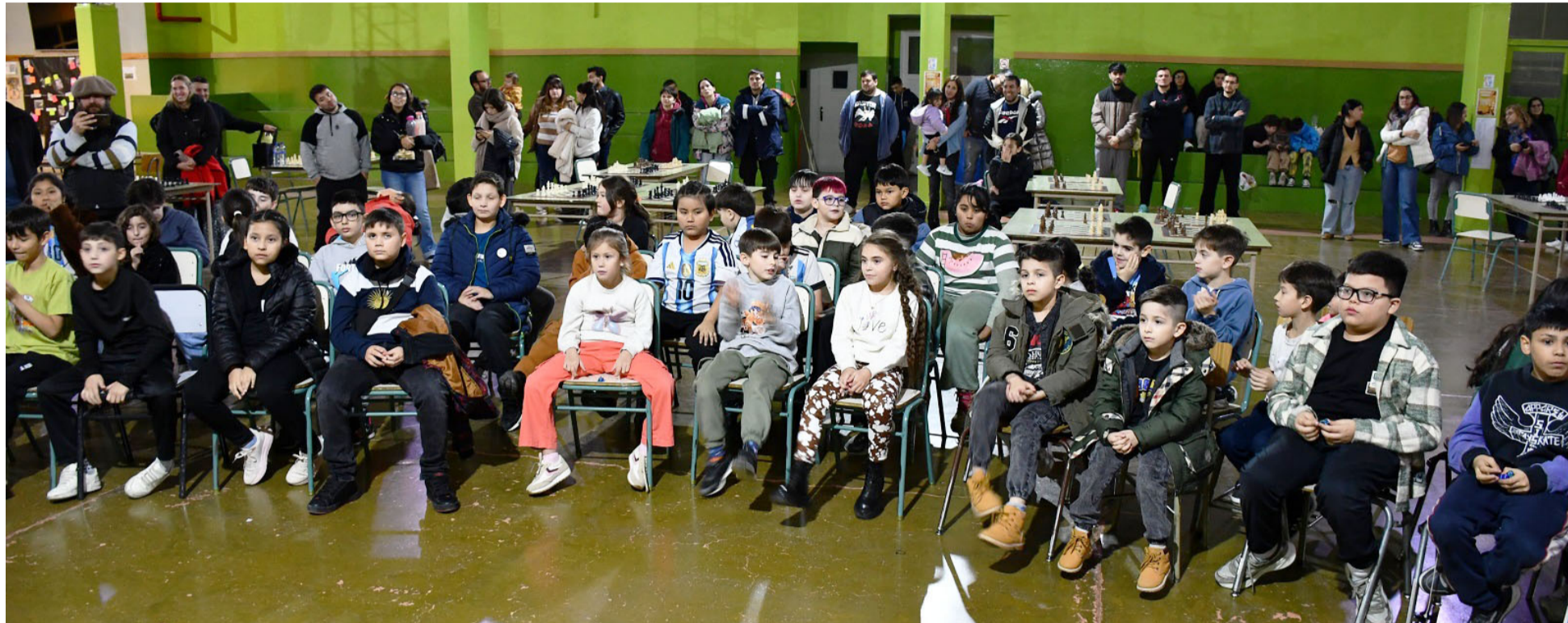
Niñas y niños de las Escuelas primarias del Cono Sur, Don Bosco, EPEIM, Escuela N° 14, Escuela N° 2, Escuela N° 21, Escuela N° 27, Escuela N° 44, Escuela N° 8 y el JIF (Juvenil Instituto Fuegoino), dijeron presente en la nueva edición del Torneo Escolar de Ajedrez en la ciudad de Río Grande.

Desde el inicio hasta el cierre del evento, madres, padres y familiares permanecieron en el lugar alentando, acompañando y celebrando cada logro.