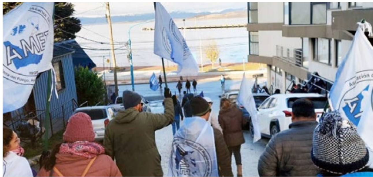
Desde AMET Tierra del Fuego se pronunciaron en contra de la propuesta salarial presentada por el Gobierno provincial.

viven todos los días las trabajadoras y los trabajadores de la educación”.