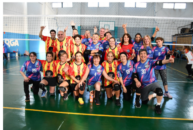
Los equipos de los clubes Hijos del Poder y Picadita, categoría +50.

"Hace algunos años Ushuaia llevaba mucha ventaja. Era muy competitiva y tenía una gran representación nacio-