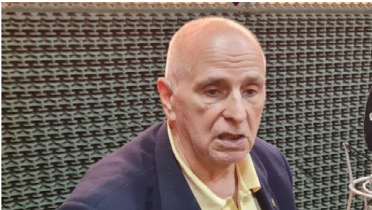
Lito Castro, ex convencional constituyente y primer vicegobernador de Tierra del Fuego.

“Si así fuera sería un error tremendo porque estamos dando de comer a la banca privada o nacional cuando la banca de la provincia es la que tiene estrecha relación con el habitante”, cerró.