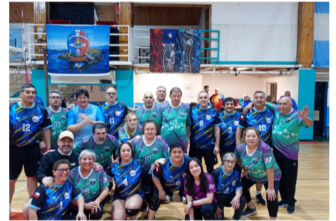
Los equipos de Porvenir (Chile) y 3° Tiempo, categoría +60