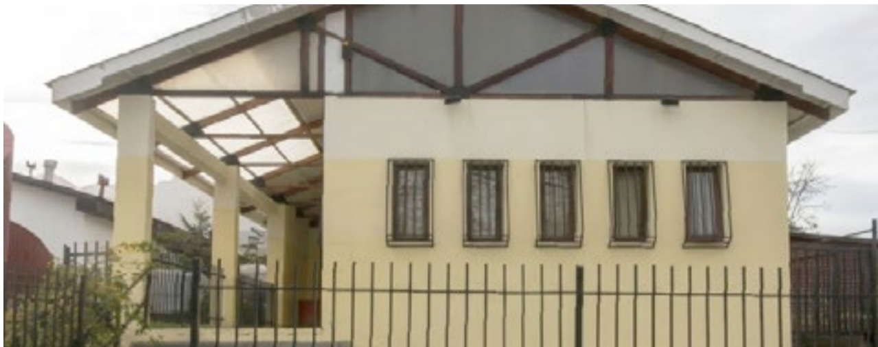
El SUTEF emitió un comunicado, donde se refirieron a la evacuación de la Escuela 34 a raíz de la presencia de monóxido de carbono.

No vamos a naturalizar el peligro dentro de las aulas ni a tolerar el acostumbramiento a la precariedad mientras se aguarda una tragedia irreversible. La integridad física de las personas está y estará siempre