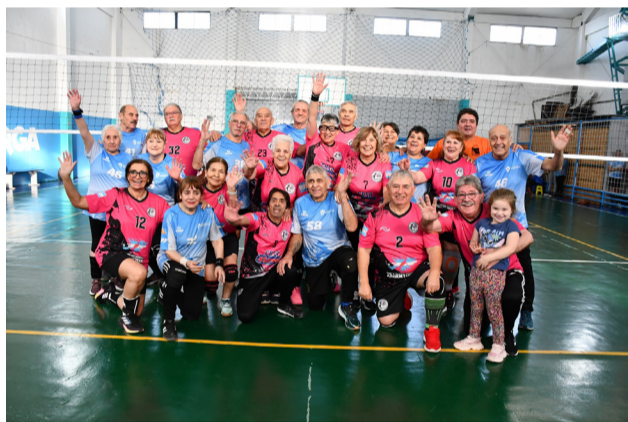
Los equipos de los clubes Pingüino y el Instituto Municipal de Deportes (Ushuaia), categoría +68.

Las actividades se desarrollaron en dos escenarios de la ciudad de Río Grande. La primera jornada tuvo lugar el