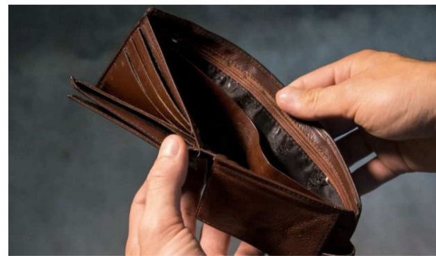
Un informe registró que 3 de cada 4 docentes de las universidades nacionales debió acudir al pluriempleo para sobrevivir.

para sobrevivir, es decir que tienen otros trabajos extrauniversitarios, y de ellos, cerca del 60 % son informales, lo que evidencia una crítica situación de precarización laboral, fenómeno de gran ac-