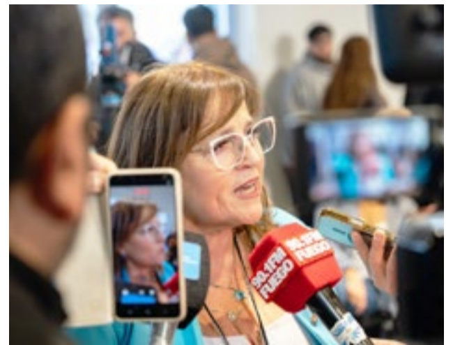
Castillo manifestó que “se entiende la incertidumbre de los trabajadores y el acompañamiento de la asociación sindical”, y remarcó que “una debe dar tranquilidad a los trabajadores, porque están siendo llamados”.

con firmeza, con sentido común, con responsabilidad para que la producción hidrocarburífera crezca, no solo en la actividad extractiva, sino también en la actividad de crecimiento en eslabones secundarios” y al mismo tiempo “seguimos en búsqueda de inversores que se sumen al desafío del crecimiento de Tierra del Fuego, la segunda cuenca hidrocarburífera de Argentina”.