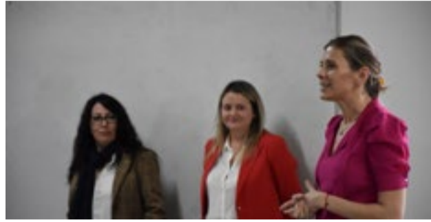
Acceso a Justicia y Supervisión Escolar realizaron la primera jornada de capacitación y reflexión sobre adolescencias y derechos.

suelen presentarse en estos procesos, como el equilibrio entre la protección y la autonomía, las decisiones