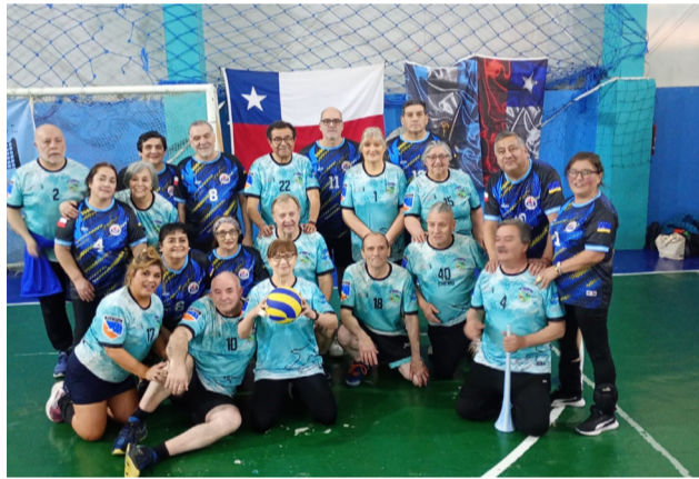
Los equipos de Porvenir (Chile) y Los Cauquenes, categoría +60.

finales a equipos de Ushuaia. Río Grande se organizó, se complementó y estuvo a la altura de las circunstancias". La categoría +68, una competencia cada vez más exigente