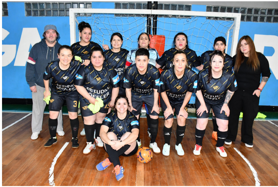
El equipo del club Fusión, primera división "B".