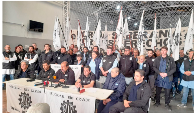
El Congreso de Delegadas y Delegados de la UOM seccional Río Grande emitió una resolución, donde vuelven a rechazar de plano la intervención y convocan a paro con movilización para el miércoles 17.

ción y las resoluciones adoptadas por el consejo directivo autoconvocado y reunido el día 26 de mayo de 2026, rechazando la intervención impuesta por la justicia, reclamando al gobierno, jueces y patrones el