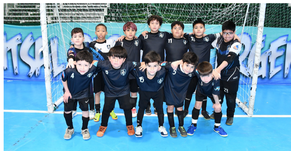
El equipo del club Luz y Fuerza, categoría 9na división.

"La idea es que los chicos puedan avanzar en sus definiciones porque tenemos un calendario muy cargado por delante. Por eso se programó esta jornada especial de Play Off para aprovechar el feriado y continuar con el desarrollo normal de todas las com-