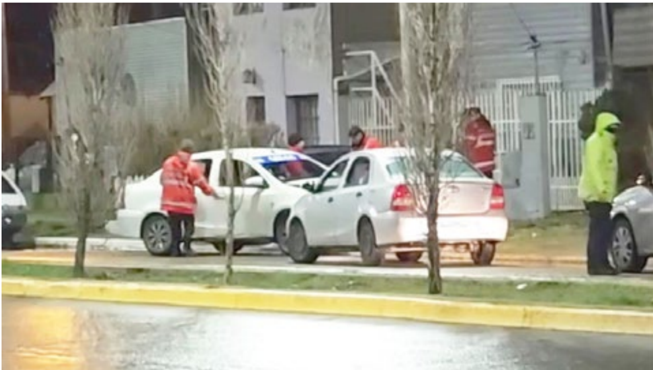
Remisero falleció tras descompensarse al volante.

Efectivos policiales y personal de salud trabajaron en la zona para resguardar el sector y llevar adelante las actuaciones correspondientes. De manera preliminar, todo indica que la muerte se produjo a raíz de una descompensación sufrida mientras conducía, aunque serán las pericias médicas las que determinen con precisión las causas del deceso.