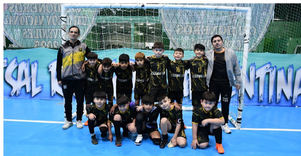
El equipo de la Academia Lion, categoría 9na división.