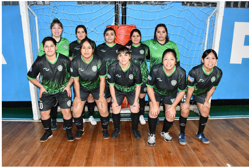
El equipo del club Q.R.U., primera división "B".

Competencia intensa y respeto dentro de la cancha