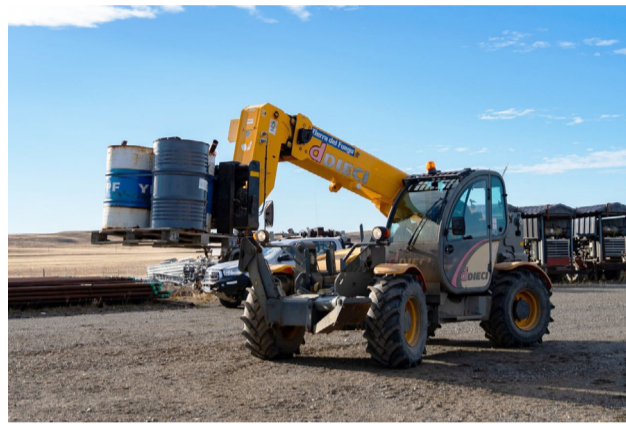
En este marco, en los últimos días finalizó la carga y despacho del primer lote de residuos ferrosos, trasladado en 35 camiones.

La iniciativa contribuye a prevenir la contaminación, recuperar el paisaje, reducir el impacto visual y proteger la biodiversidad en zonas de pastoreo de gana-