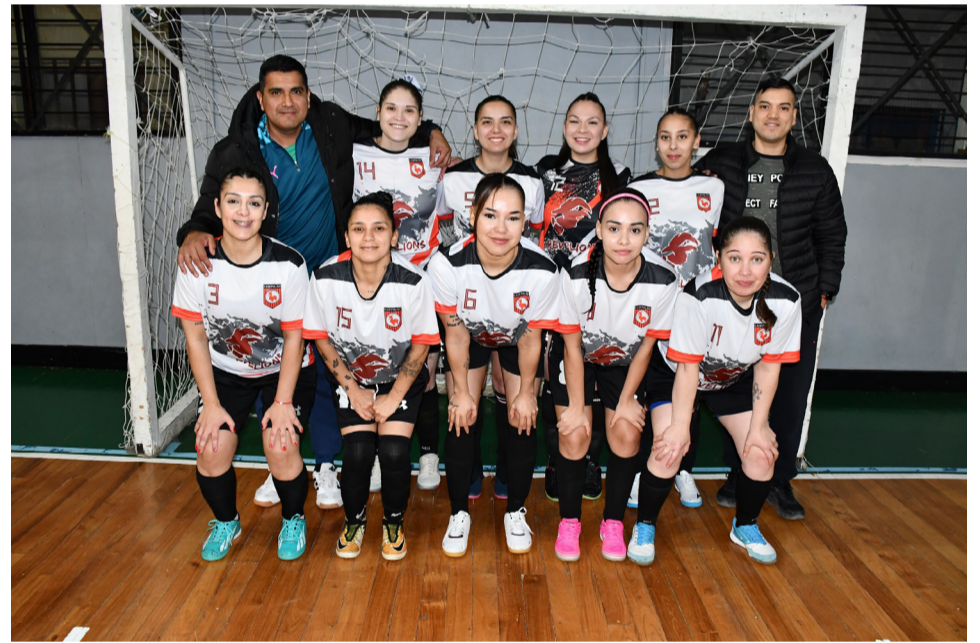
El equipo del club Campolter, primera división "B".

"Quizás podríamos estar cobrando una entrada para ayudar a las selecciones y a otras actividades, pero dada la situación crítica que vive el país creemos que hoy cobrarle a una familia para que venga a ver jugar a su hija sería sumar un problema