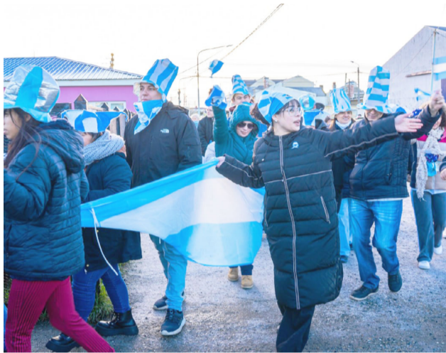
La jornada se llevará a cabo el próximo 19 de junio con actividades simultáneas en Río Grande y Tolhuin.

En Río Grande, la concentración será a las 9:45 horas en el Centro de Actividades para Personas Ma-