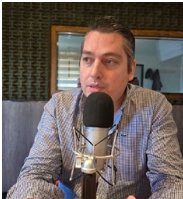
Tras la misión en China, Pérez anunció el interés de empresas tecnológicas en invertir en Río Grande.

El intendente explicó que “la firma desarrolla tecnología aplicada a múltiples áreas, no solamente fabrican drones para combatir incendios forestales o asistir a los bomberos. También desarrollan sistemas