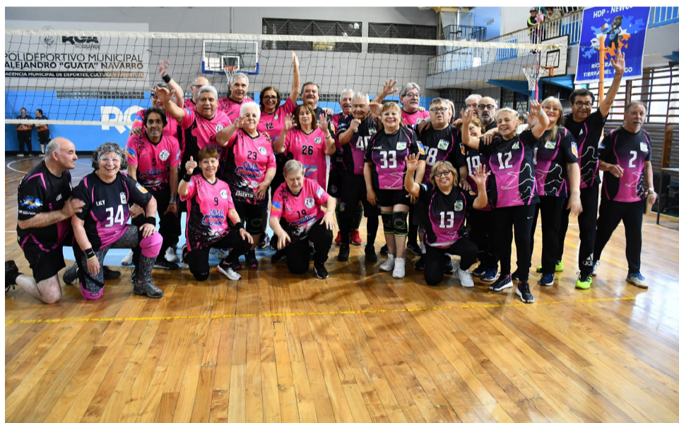
Los equipos Los Cauquenes y Pingüino, categoría +68.

La dirigente destacó especialmente la participación de representantes de Porvenir, Chile, un hecho que demuestra el alcance que ha adquirido la competencia