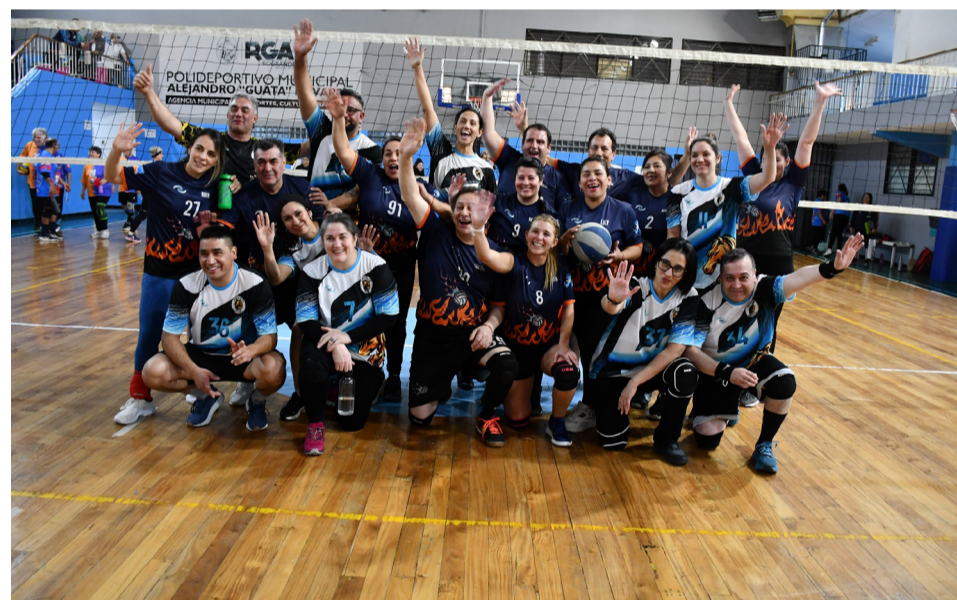
Los equipos de Wikam y Indomables, categoría promocional +40.

Polideportivo Ezequiel Rivero de Tolhuin con la séptima jornada del certamen. Una vez más, las tribunas acompañaron con un importante marco de público, reflejando el interés que despierta una disciplina que continúa conquistando adeptos en toda la provincia.