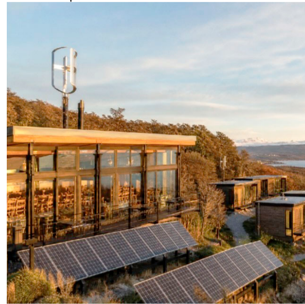
Consultado por la implementación de la acuicultura y la hidroponía, dijo que “son cabañas que esperamos que sean con un servicio premium, con un restaurante de kilómetro cero, utilizando los mismos productos del lugar más productos regionales”.

Finalmente, Polonsky adelantó que el crecimiento futuro contempla una etapa complementaria en la zona norte de la provincia para el engorde, procesamiento y exportación de la producción.