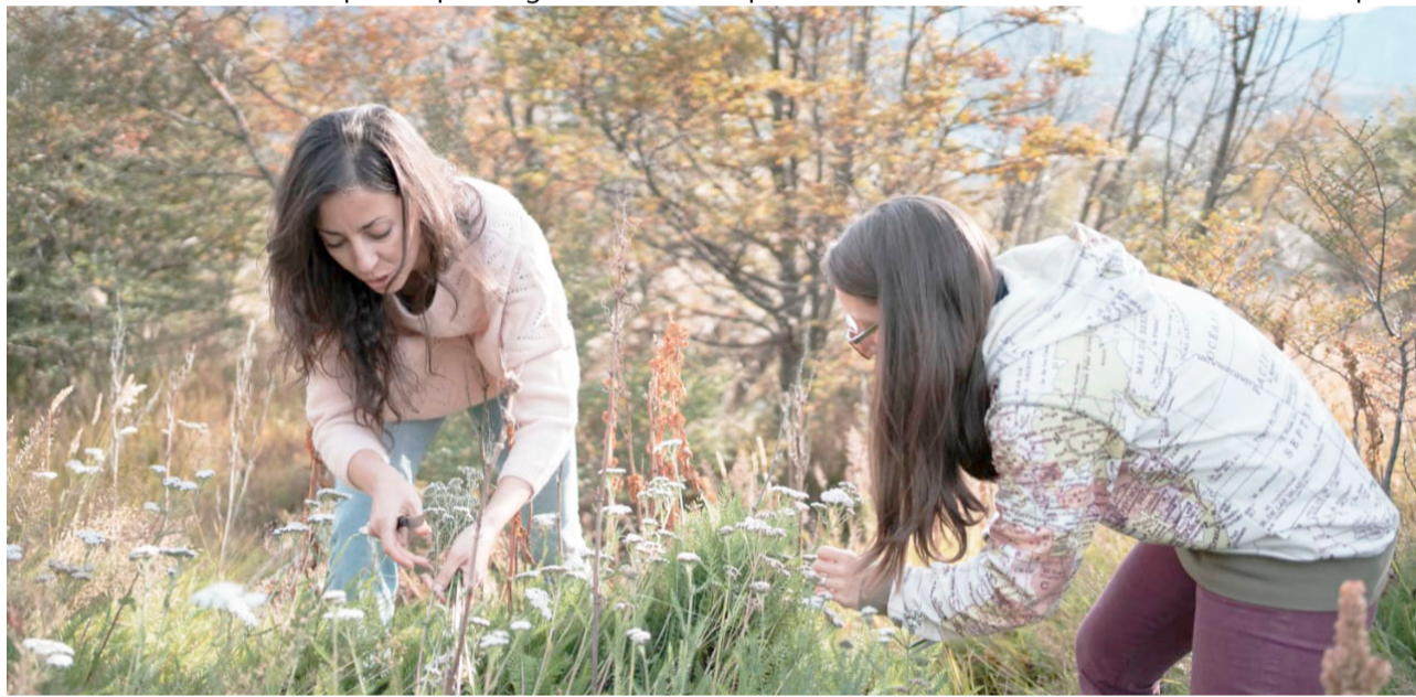
Un emprendimiento fueguino fusiona el turismo y la gastronomía invita a salir del modo automático para consumir y elaborar alimentos, reconectando con el entorno a través de caminatas de recolección y talleres de cocina salvaje.

Además de los talleres arancelados dictados por profesionales del turismo y la gastronomía, el proyecto impulsa encuentros comunitarios gratuitos, como la reciente cosecha colectiva de manzanos urbanos en veredas donde la fruta solía echarse a perder. A partir de estas salidas se consolidó una comunidad que comparte ubicaciones de árboles, recetas y pedidos de permiso a los vecinos para futuras recolecciones, tejiendo lazos vecinales. "Se da una cuestión linda de