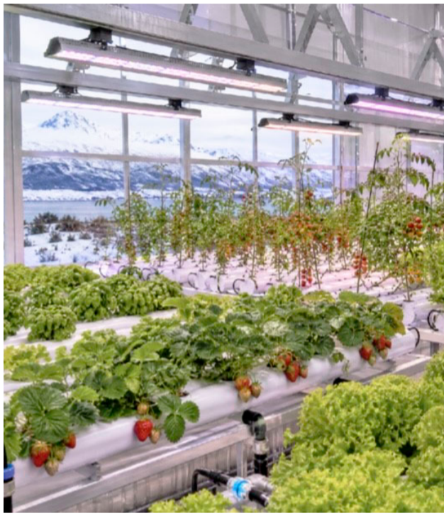
Consultado por la implementación de la acuicultura y la hidroponía, dijo que “son cabañas que esperamos que sean con un servicio premium, con un restaurante de kilómetro cero, utilizando los mismos productos del lugar más productos regionales”.

Consultado por la implementación de la acuicultura y la hidroponía, dijo que “son cabañas que esperamos que sean con un servicio premium, con un restaurante de ki-