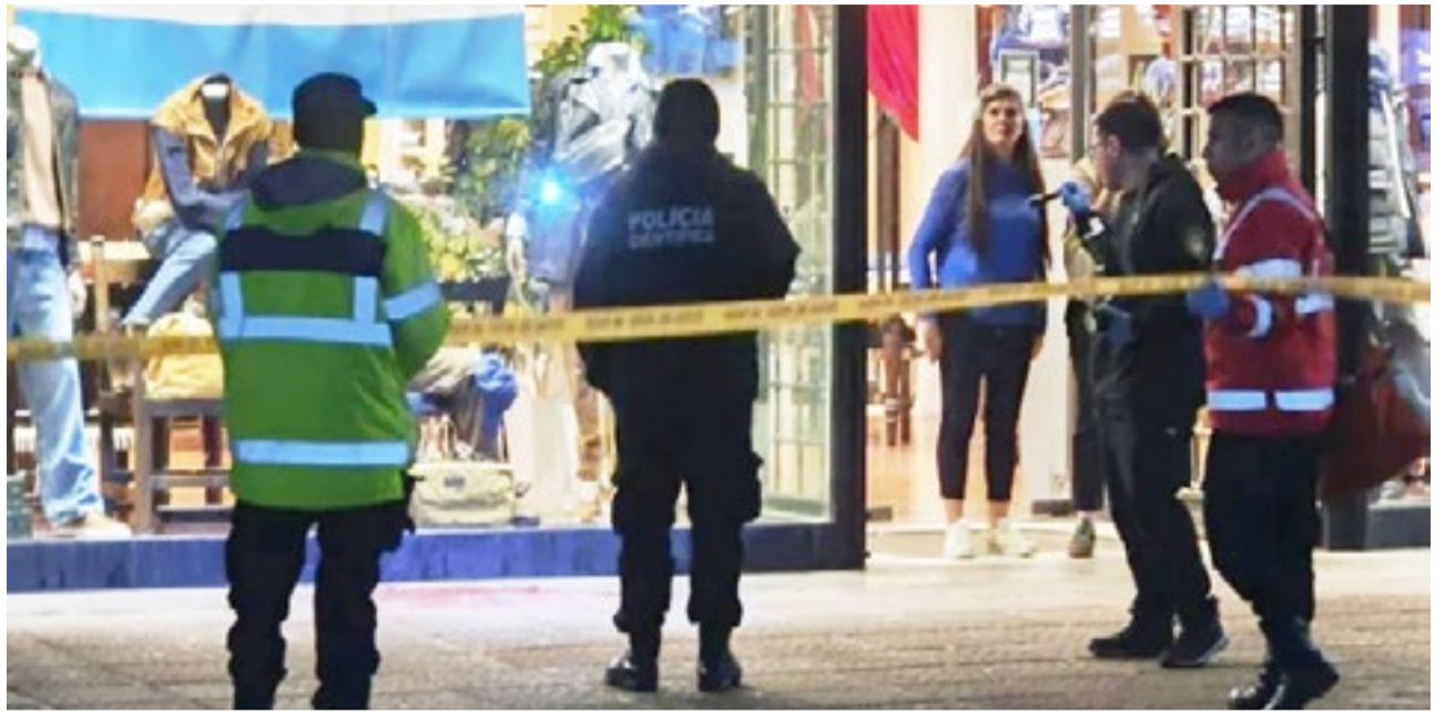
Un adolescente herido en una pelea en pleno centro de Río Grande

El episodio, ocurrido en una de las zonas más transitadas de la ciudad, volvió a encender el debate sobre la violencia juvenil y los enfrentamientos que involucran a adolescentes en espacios públicos.