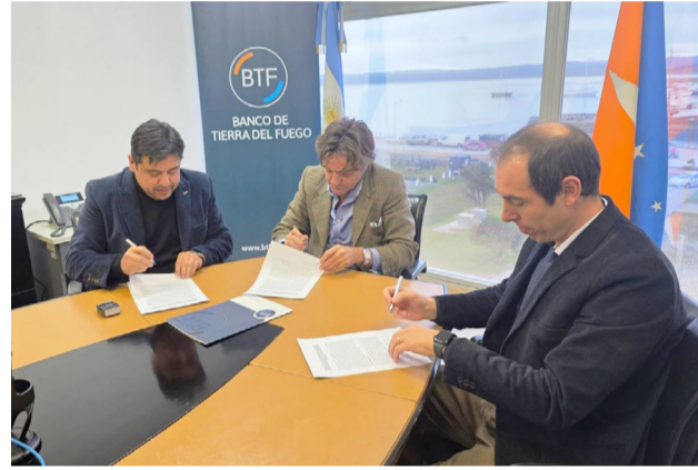
Esta iniciativa se inscribe de manera directa dentro de las prioridades de desarrollo territorial definidas en el Plan 2026.

Además, el formato de esta innovadora operatoria, impulsada por el municipio y el banco, promueve la