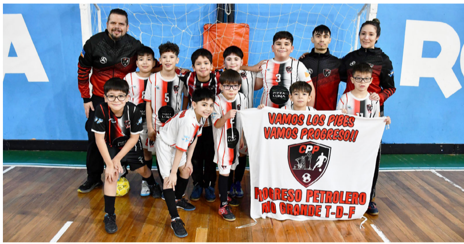
El equipo del Club Progreso, categoría C9.

En ese sentido, explicó que la prioridad inmediata fue garantizar la continuidad de