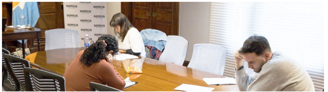
El Ministerio de Salud de Tierra del Fuego llevó adelante el pasado jueves y viernes los exámenes correspondientes al concurso para el ingreso a las residencias del sistema público de salud provincial.

Por último, el director de Residencias Médicas de la Provincia remarcó la importancia de fortalecer los programas de capacitación profesional. "Invertir en residencias es invertir en recurso humano bien capacitado, y eso se