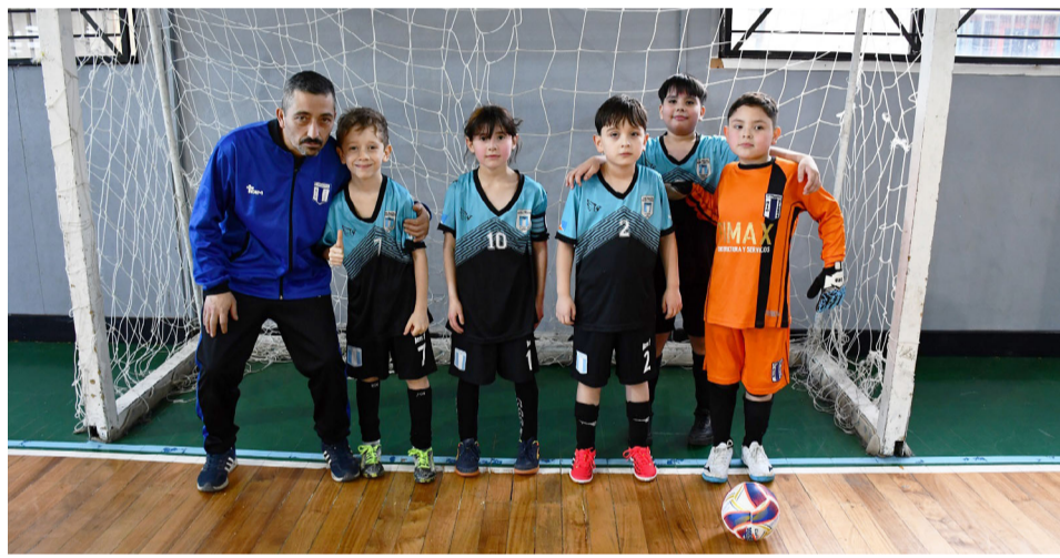
El equipo del Club O'Higgins, categoría C9.