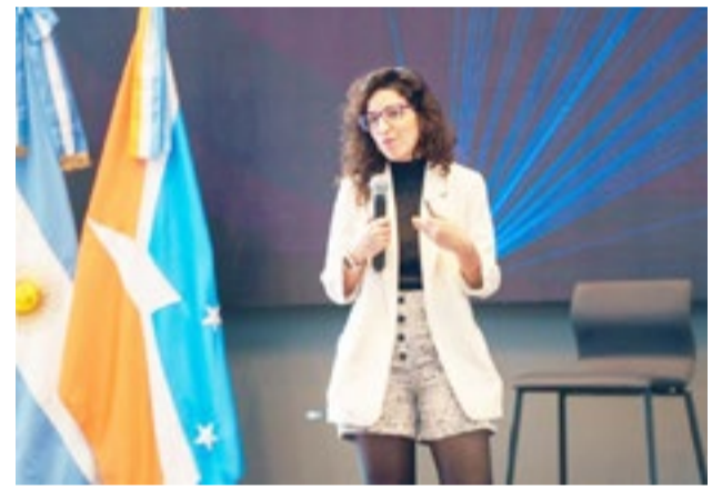
Talento fueguino: Crearon una plataforma para denuncias de violencias por motivos de género que se utiliza en Chaco y Santiago del Estero