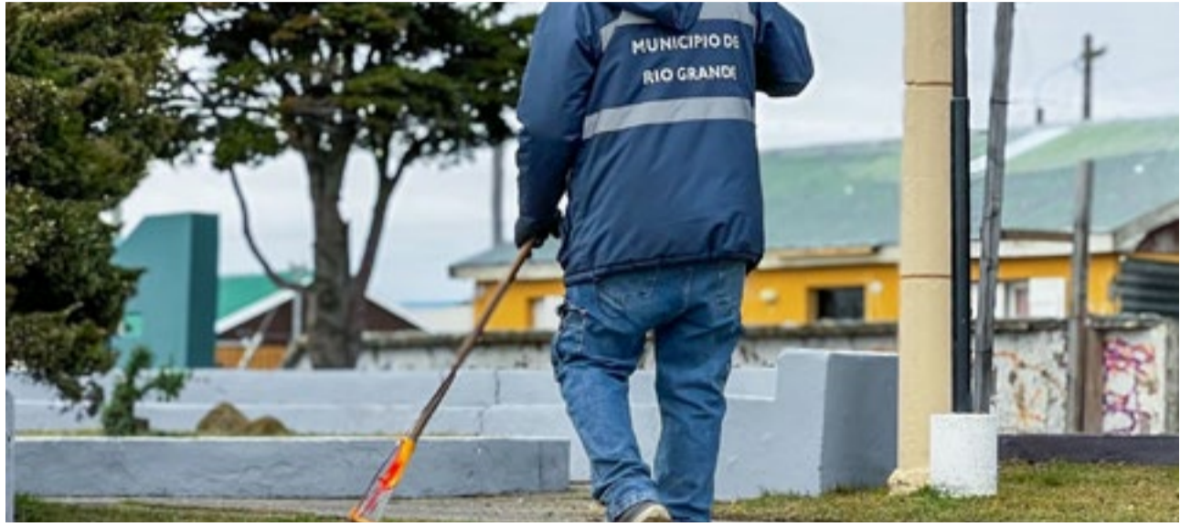
El Municipio de Río Grande continúa llevando adelante acciones de embellecimiento, reacondicionamiento y limpieza en distintos sectores de la ciudad, con el objetivo de preservar y poner en valor los espacios públicos para el disfrute de las vecinas y vecinos.

A través de estas intervenciones, el Municipio reafirma su compromiso con el cuidado y la puesta en valor de los espacios públicos, promoviendo una ciudad más accesible, ordenada y segura para toda la comunidad.