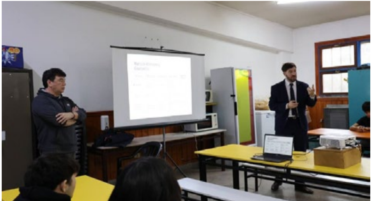
“Acercándonos a la Comunidad” brindó herramientas para la prevención de riesgos digitales a estudiantes de la EPET en Ushuaia.

El programa “Acercándonos a la Comunidad” busca generar espacios de diálogo con distintos sectores de la sociedad para difundir conocimientos sobre derechos, acceso a la justicia y temas de interés social, con el propósito de acercar los servicios del Poder Judicial a la ciudadanía.