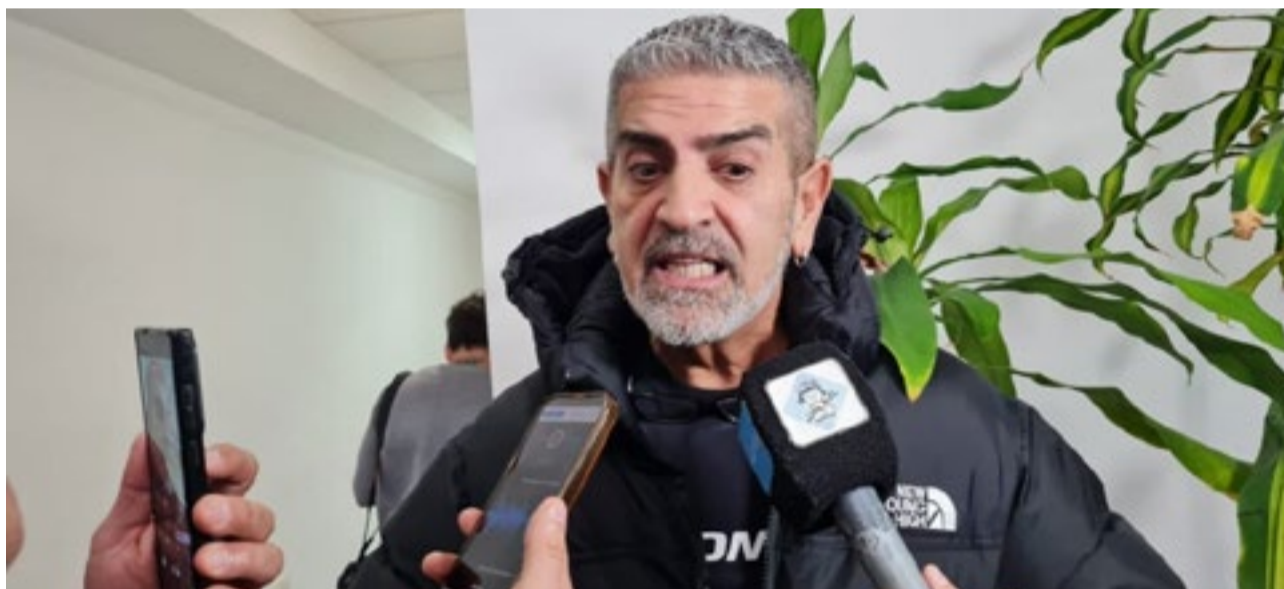
El ministro de Educación de la provincia, Pablo López Silva, brindó detalles sobre las medidas adoptadas por la cartera educativa para garantizar la continuidad de las clases mientras se ejecutan las obras necesarias para resolver los inconvenientes de infraestructura.

Uno de los compromisos asumidos por el Ministerio durante la reunión con los padres fue mantener un seguimiento permanente del avance de las obras.