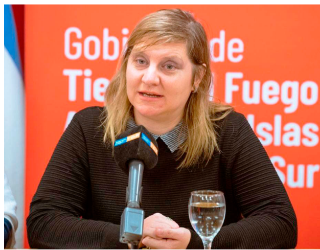
La ministra de Salud de la provincia, Judit Di Giglio, realizó un amplio análisis sobre la situación sanitaria de Tierra del Fuego y destacó los avances alcanzados en materia de formación de profesionales, cobertura de residencias médicas y fortalecimiento de los servicios de salud mental.

“Pueden participar médicos, enfermeros, terapeutas