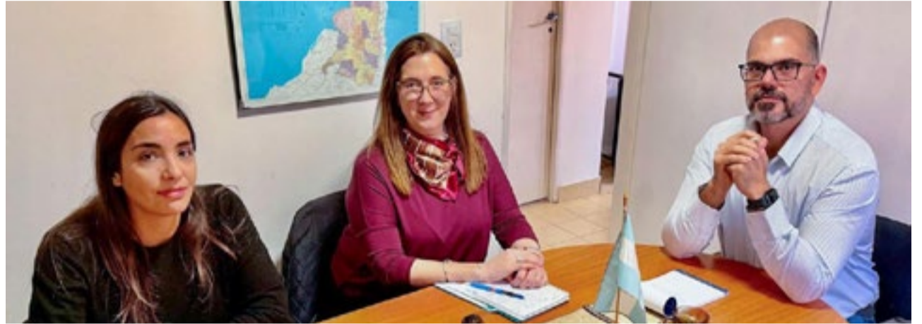
En articulación con RENATRE y UATRE, el Municipio de Río Grande avanza en nuevas instancias de capacitación destinadas a recuperar oficios tradicionales del campo.

Desde el Municipio remarcaron que la recuperación de oficios rurales forma parte de una estrategia integral