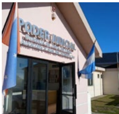
El acusado, de 35 años, será juzgado por una agresión ocurrida durante una reunión social en julio de 2025. La víctima sufrió heridas que pusieron en riesgo su vida.

Para la primera jornada del debate está prevista la declaración de ocho testigos.