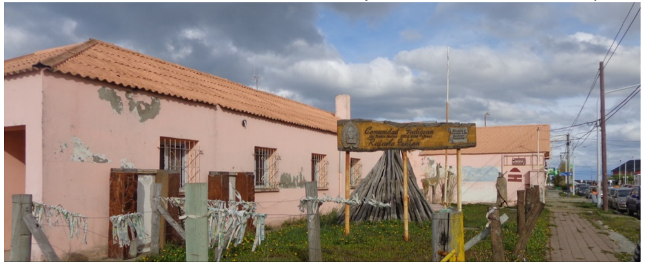
Según trascendió, la Asamblea Extraordinaria de la Comunidad Indígena selk'nam Rafaela Ishton resolvió la expulsión de cuatro de sus miembros.

Finalmente, se informó que las decisiones ya fueron notificadas formalmente al Gobierno de Tierra del Fuego, a las municipalidades de Río Grande, Tolhuin y Ushuaia, además de los organismos competentes, y aseguró que cuentan con el acompañamiento del Consejo de Ancianos, la Comisión Directiva y el Ór-