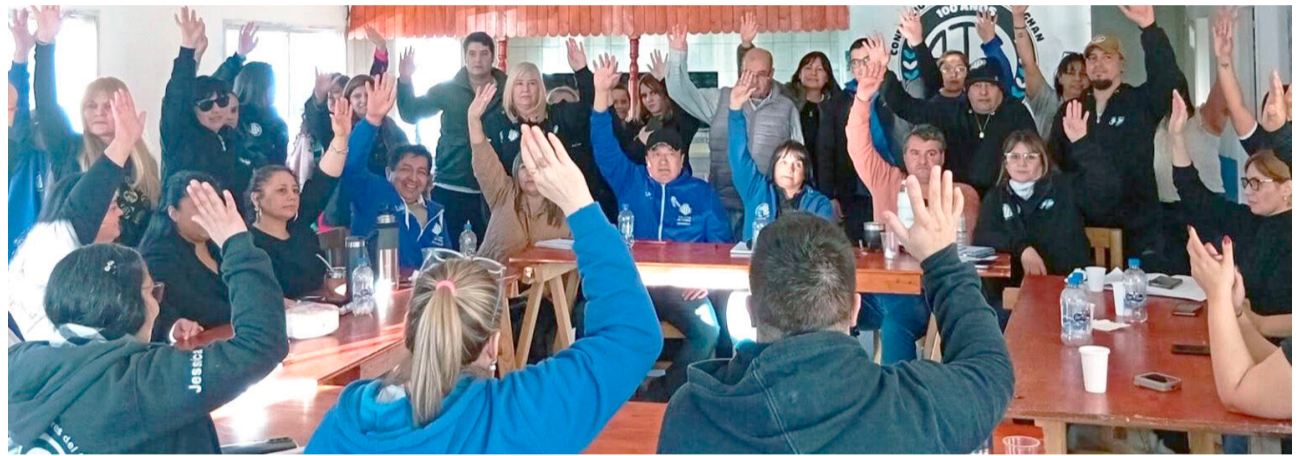
Desde el sindicato estatal expresaron "preocupación por el secretario General del Consejo Directivo Provincial" fueguino, que "continúa privado de su libertad mientras la sentencia en su contra sigue siendo revisada judicialmente".