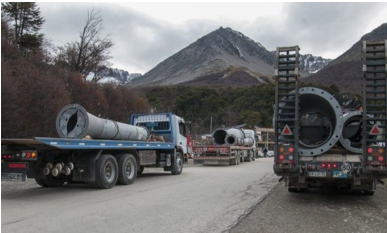
Representantes de la campaña “Defendamos el Martial” manifestaron su profundo malestar, ante lo que consideran es una entrega del patrimonio público.

Para terminar, afirmando que “no se van a bajar los brazos porque la meta es generar conciencia de que la población local no comulga con estas prácticas entreguistas. Lejos de la contaminación y la mercantilización, lo que se exige es el diseño de políticas públicas reales orientadas a la soberanía alimentaria, soluciones habitacionales genuinas y empleo digno para el bien común, no un empleo sostenido en la precarización absoluta”.