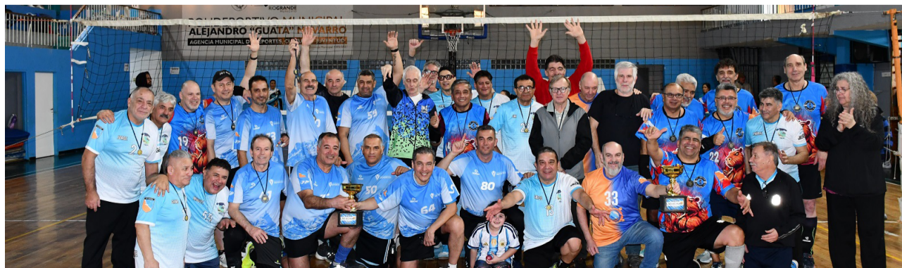
Equipos de las ciudades de Río Grande, Ushuaia y Tolhuin en las categorías +50 y +60 disfrutaron del espectacular Torneo “Día del Padre”.