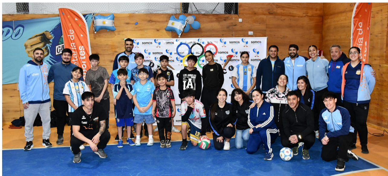
La secretaria de deportes provincial conmemoró en las tres ciudades fueguinas el Día Olímpico junto a todas las escuelas deportivas de la ciudad de Río Grande.

“La idea es que los chicos puedan vivenciar deportes diferentes al que practican habitualmente. Cada uno pertenece a una escuela deportiva determinada, pero en jornadas como ésta tienen la oportunidad de co-