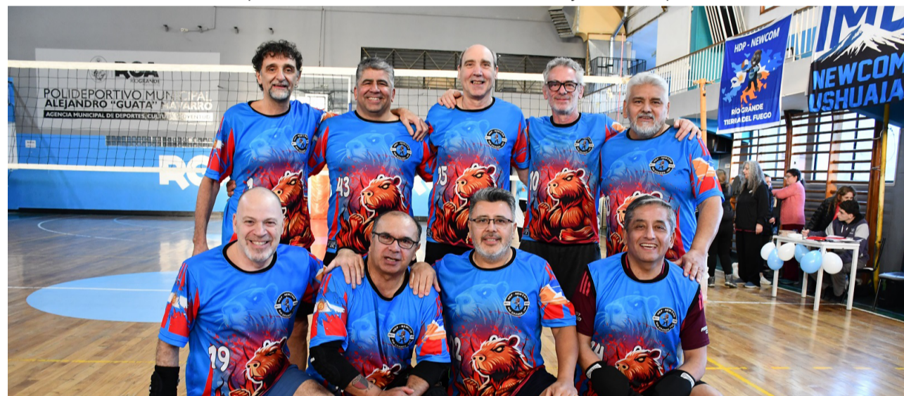
El equipo de Hijos del Poder, categoría +50.

“Muchos siguen haciéndose cargo de sus nietos. A veces no pueden venir a entrenar porque están cuidándolos. Cumplen una función muy importante dentro de la familia y creemos que también merecen tener su