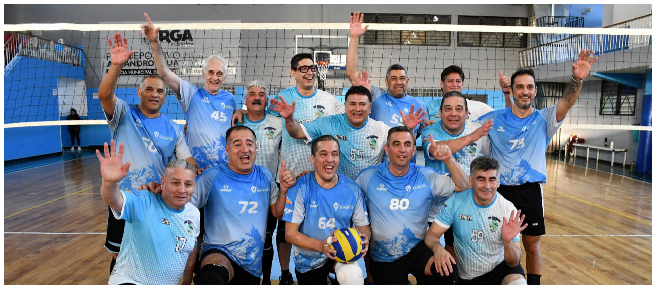
El equipo de Los Cauquenes, categoría +50.

La planificación responde a una idea muy clara. “Durante el año hacemos dos torneos femeninos y dos masculinos: uno por el Día de la Mujer y otro por el Día de la Madre; y para los hombres organizamos el del Día del Padre y el del Día del Hombre. Queremos que todos tengan su espacio”.