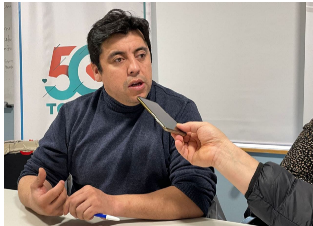
“El proyecto del Parque Termal está entrando en su etapa de formalización y esperamos que el Concejo lo trate cuanto antes”, sostuvo Harrington.

El intendente confirmó que esa instancia participativa concluyó y que ahora comienza una etapa más técnica destinada a transformar todas las propuestas en un proyecto legislativo.