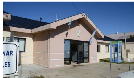
Hoy serán los alegatos en el juicio a un hombre acusado del abuso de su hija.

Río Grande. - El Tribunal de Juicio en lo Criminal del Distrito Judicial Norte reanudó este lunes el juicio oral y no público contra un hombre acusado de