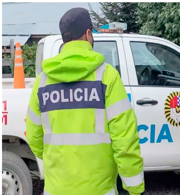
Prisión preventiva para dos acusados de desvalijar una vivienda en Ushuaia tras una rápida investigación.

Además, la División Policía Científica levantó rastros de calzado en la escena del hecho, los cuales coincidieron con las zapatillas secuestradas posteriormente