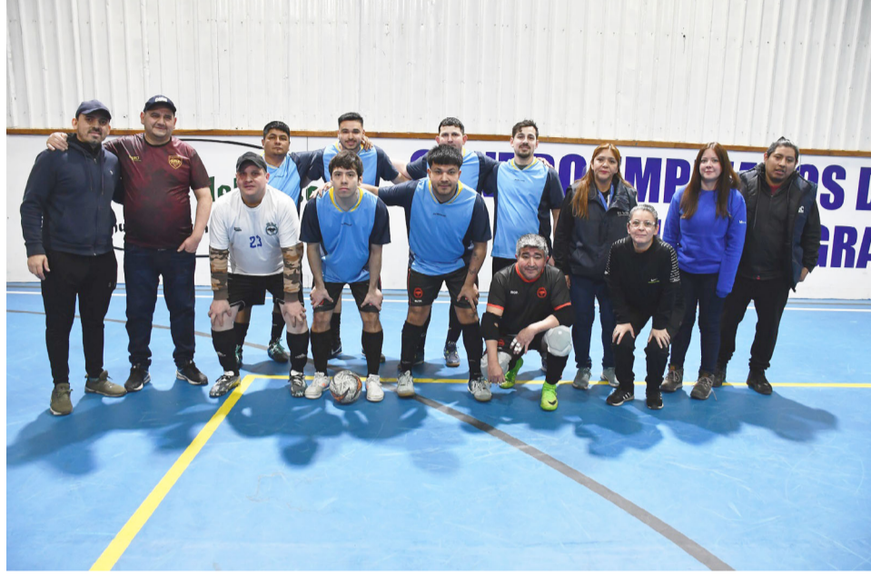
El equipo de La Costa, categoría libre.

"Hay menos equipos que el año pasado, pero se entiende perfectamente el momento que estamos viviendo. Lo importante es que el torneo sigue adelante