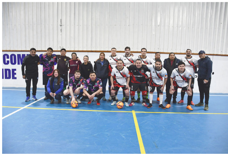
Los equipos de Borussia FC vs. Los Traidores, categoría libre.

Río Grande.- Con la disputa de la segunda jornada de competencia, el Torneo Amistad 2026 continúa consolidándose como uno de los encuentros deportivos y sociales más importantes del calendario del Centro de Empleados de Comercio de Río Grande. La competencia, que este año reúne a 17 equipos, mantiene