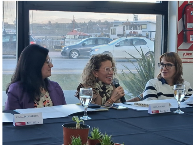
El Ministerio Público Fiscal consolidó la articulación institucional en una nueva reunión del Consejo Consultivo de la Mujer.