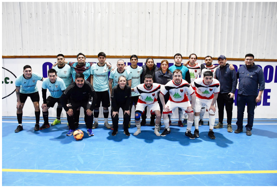
Los equipos de Hiper vs. Real Bover, categoría libre.