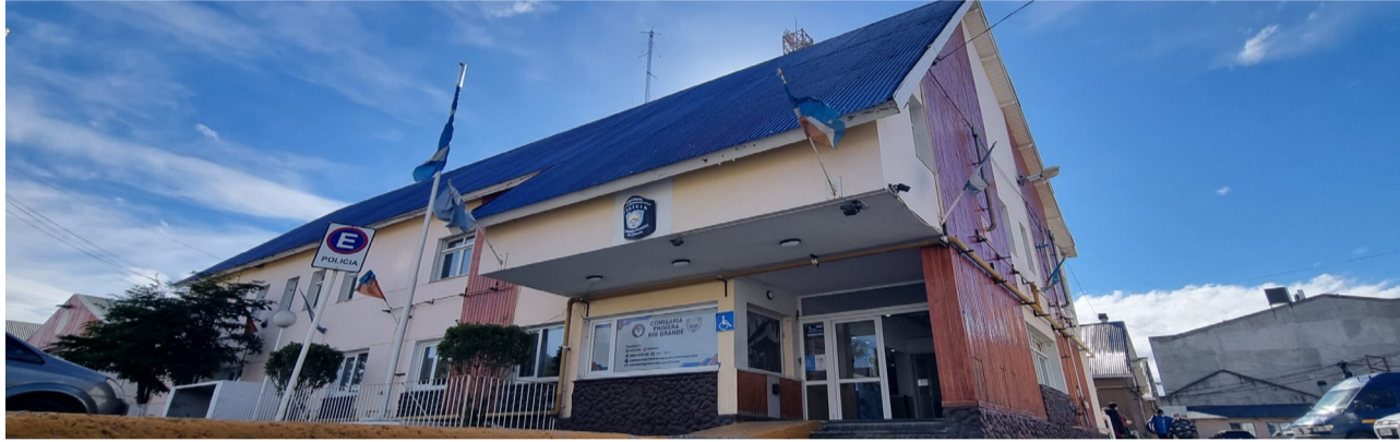
Cinco pedidos de paradero en menos de una semana y todas personas fueron encontradas en buen estado de salud. (Imagen ilustrativa).

En todos los casos, la Policía Provincial informó oportunamente el cese de las búsquedas una vez establecida la ubicación de las personas, destacando que no fue necesario mantener activados los pedidos de colaboración pública.