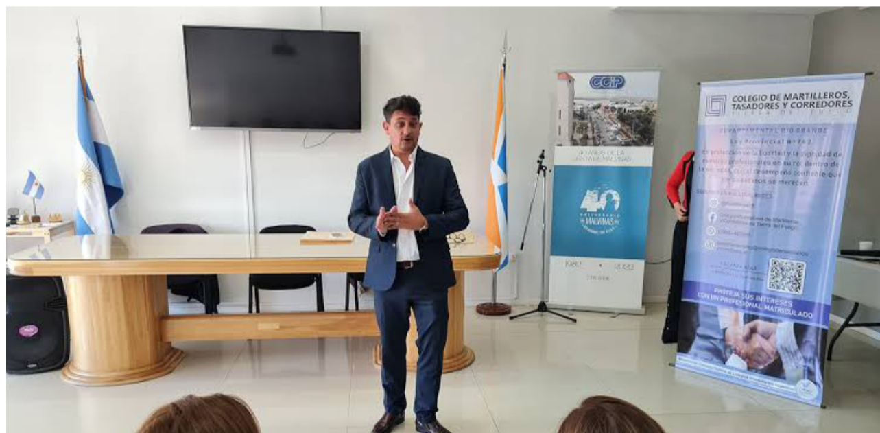
"La gente hoy busca precio y alquiler de dos dormitorios porque sirve tanto para quien necesita reducir gastos como para quien quiere ampliarse", manifestó.

Finalmente, consultado por el nuevo régimen de actualización catastral impulsado en la provincia y sostuvo que "la norma de fondo está bien, es necesaria, porque todos sabemos que Río Grande se ha formado de manera desordenada. Pero para poder acomodar tu parcela tenés que hacer un agrimensur y pagar sellados. Para mí, principalmente tiene un fin recaudatorio, de eso no tengo la menor duda".