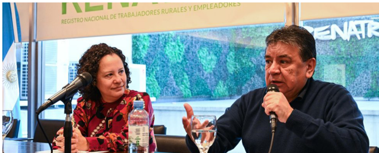
El Registro Nacional de Trabajadores Rurales y Empleadores (RENATRE) junto a la Organización Internacional del Trabajo (OIT) realizaron, en la sede central del organismo ubicada en la Ciudad Autónoma de Buenos Aires, la jornada "Hacia una guía operativa para la migración laboral agrícola temporaria en Argentina".

Cabe destacar que del encuentro también participaron representantes del RENATRE, OIT, la Procuraduría de Trata y Explotación de Personas (PROTEX), ministerios de trabajo de las provincias de Buenos Aires, Misiones, Tucumán, Mendoza y Río Negro, la Facultad de Ciencias Sociales de la UBA, el CEIL-CONICET, y delegados de UATRE tanto de manera presencial como virtual.